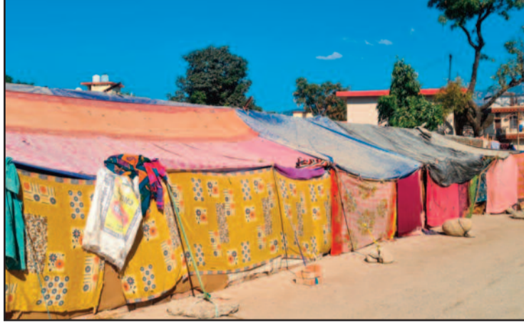
कोटद्वार के काशीरामपुर तल्ला में सड़क किनारे टेंट लगाकर रह रहे आपदा प्रभावित परिवार

कोटद्वार : धीरे-धीरे ढंड का प्रकोप लगातार बढ़ता जा रहा है। ऐसे में गाड़ीघाट, काशीरामपुर तल्ला के आपदा प्रभावित परिवार पुनर्वास की आस में सड़क किनारे टेंट लगाकर दिन काट रहे हैं। ऐसे में सबसे अधिक परेशानी बुजुर्ग व बच्चों को हो रही है। लगातार पुनर्वास की मांग