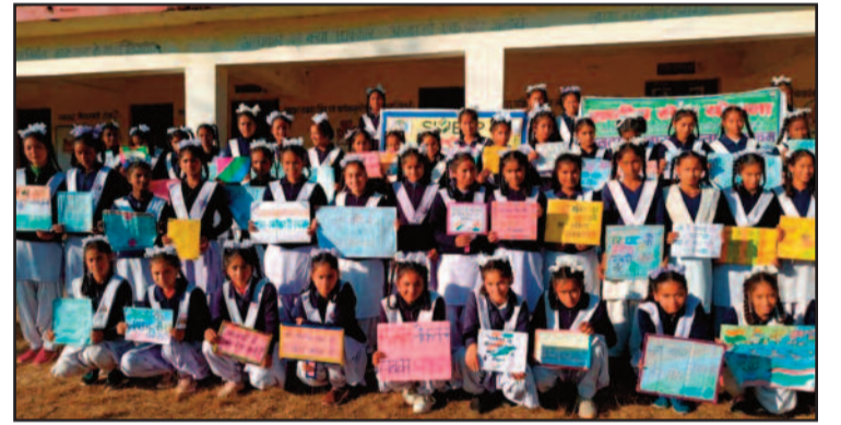
आयोजित कार्यक्रम में भाग लेते विद्यार्थी