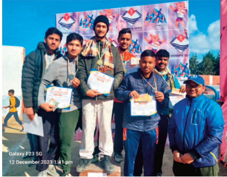
जिला स्तरीय खेल महाकुंभ के विजेता खिलाड़ी।