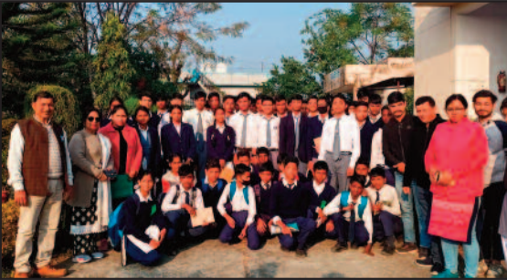
शैक्षणिक भ्रमण करते राजकीय इंटर कालेज कोटद्वार के विद्यार्थी