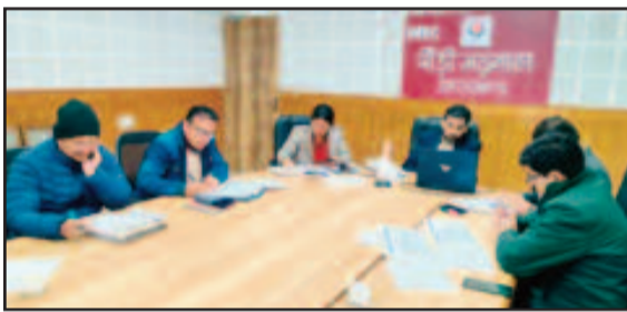
डीएम डॉ. आशीष चौहान बैठक में अधिकारियों को निर्देश देते हुए।

पौड़ी : जिलाधिकारी डॉ. आशीष चौहान ने जिला कार्यालय स्थित एनआईसी कक्ष में जल जीवन मिशन के कार्यों की प्रगति की समीक्षा बैठक ली। जल जीवन मिशन के कार्य की धीमी प्रगति पर जिलाधिकारी ने नाराजगी व्यक्त करते हुए अधिशासी अभियंता जल निगम पौड़ी के