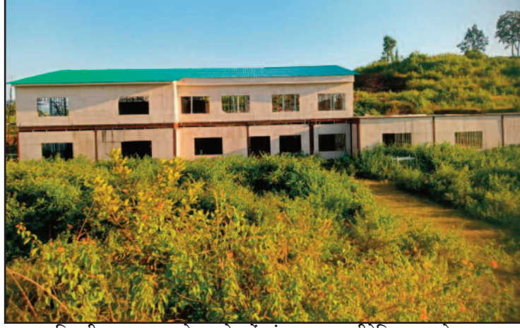
रिखणीखाल ब्लाक के बड़खेत में खंडहर पड़ा पालीटेक्निक कालेज भवन

कार्यदायी संस्था उत्तर प्रदेश निर्माण निगम को भवन निर्माण की जिम्मेदारी सौंपी गई। लेकिन, पिछले दस वर्षों से भवन