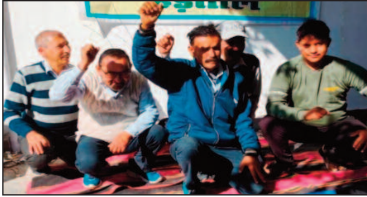
कोटद्वार मुख्य डाकघर परिसर में धरना देते डाककर्मियों