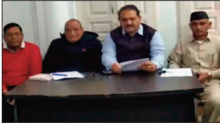
कोटद्वार में वार्ता करते कांग्रेसी

कहा कि असम में कांग्रेस की तरफ गोगोई सरकार में मंत्री रहते हुए हेमंत बिस्वा सरमा पर सीबीआई ने केंद्र की भाजपा सरकार के इशारे पर गंभीर आरोप लगाए, इसके बाद हेमंत बिस्वा सरमा के अगस्त 2015 में भाजपा में शामिल होते ही