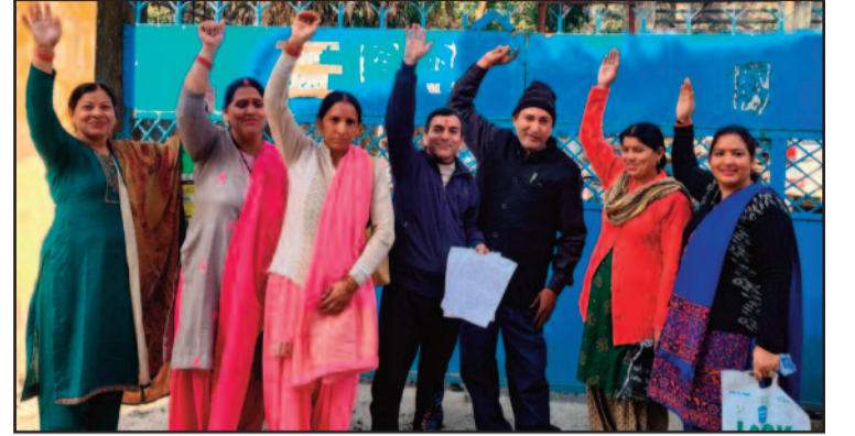
जल संस्थान कार्यालय के प्रवेश द्वार पर प्रदर्शन करते लोग

कहा लाख शिकायतों के बाद भी समस्या को लेकर लापरवाह बने हैं अधिकारी