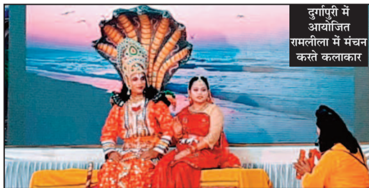
दुर्गापुरी में आयोजित रामलीला में मंचन करते कलाकार