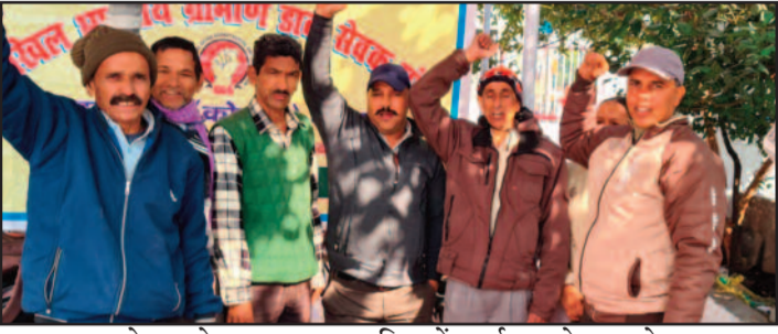
कोटद्वार के मुख्य डाकघर परिसर में प्रदर्शन करते डाक सेवक

कोटद्वार : 11 सूत्रीय मांगों के निराकरण को लेकर अखिल भारतीय ग्रामीण डाक सेवक संघ की हड़ताल शुरुवार को चौथे दिन भी जारी रही। इस मौके पर डाक सेवकों ने उन्हें नियमित कर्मचारी का दर्जा व पेंशन देने समेत अन्य मांगों को लेकर नारेबाजी करते हुए प्रदर्शन किया। शुरुवार को ग्रामीण डाक सेवक संघ की कोटद्वार शाखा से जुड़े डाक सेवक बद्रिनाथ मार्ग स्थित मुख्य डाकघर में एकत्र हुए। यहां उन्होंने नारेबाजी करते हुए प्रदर्शन किया। इस मौके पर हुई सभा में वक्ताओं ने कहा कि वह विषम परिस्थितियों में लगातार अपनी