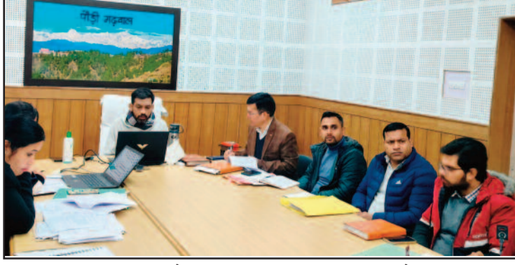
डीएम डॉ. आशीष चौहान जिला सड़क सुरक्षा समिति की बैठक लेते हुए।

उन्होंने कहा कि क्रिसमस डे व थर्टी फर्स्ट के दौरान वाहनों की नियमित चेकिंग करें। उन्होंने विशेषकर श्रीनगर, लैंसडाउन, कोटद्वार व यमकेश्वर क्षेत्र में सतर्क रहने के निर्देश उपजिलाधिकारी, पुलिस, परिवहन विभाग के अधिकारियों