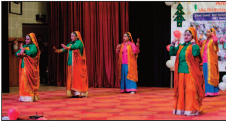
प्रेक्षागृह में आयोजित कार्यक्रम के दौरान सांस्कृतिक प्रस्तुति देती महिलाएं