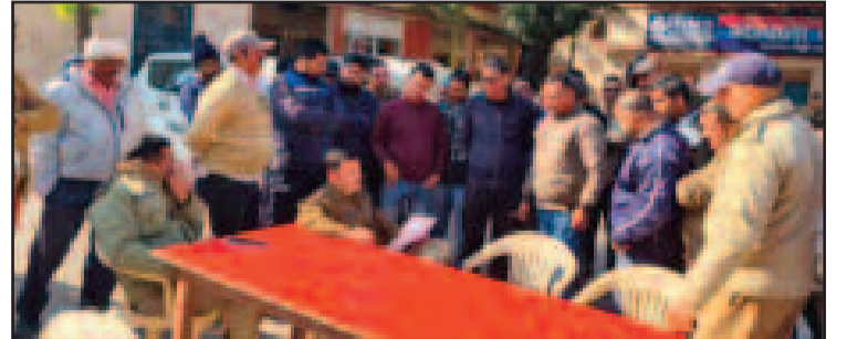
कोटद्वार कोतवाली में अपनी शिकायत लेकर पहुंचे ई-रिक्शा चालक

कोटद्वार : शहर में ई-रिक्शा चालकों का विवाद थमने का नाम नहीं ले रहा। आए दिन रूट को लेकर ई-रिक्शा चालकों के बीच विवाद हो रहा है। सोमवार को कोतवाली में पहुंचे नजीबाबाद चौराहे से संचालित होने वाले ई-रिक्शा चालकों ने दुर्गापुरी रूट के चालकों पर मारपीट का आरोप लगाते हुए रूट निर्धारित करने की मांग की।