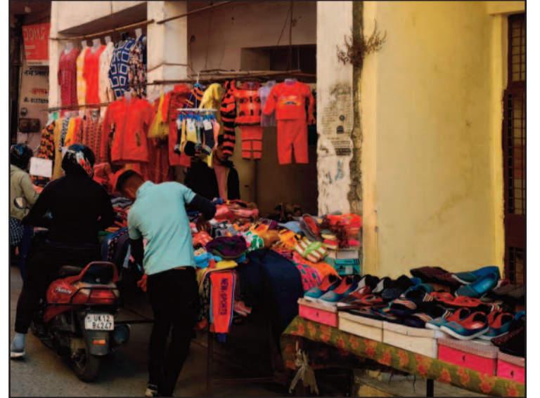
कोटद्वार के गंगादत्त जोशी मार्ग पर सड़क में सजी दुकानें

विवाद करने लगते हैं। पूर्व में शहरवासियों ने इसकी शिकायत अधिकारियों से भी की थी। लेकिन, अधिकारियों ने समस्या को गंभीरता से नहीं लिया।