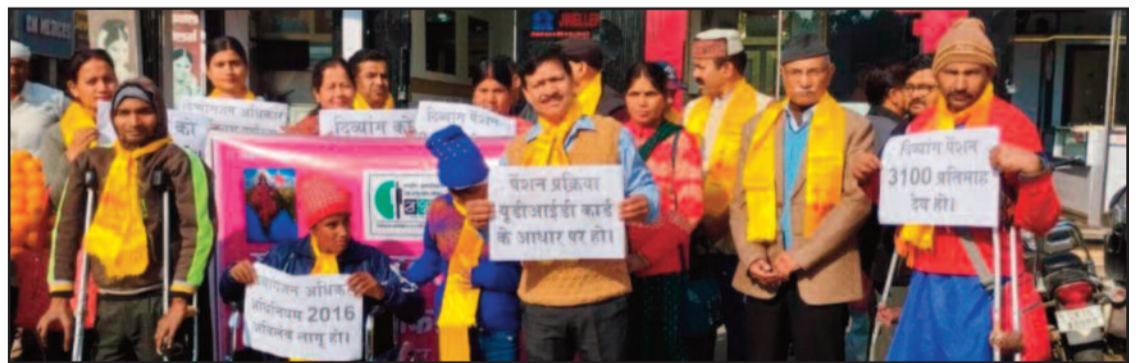
कोटद्वार में आक्रोश रैली निकालते दिव्यांग जन

गुरुवार को क्षेत्र के दिव्यांग जन दिव्यांग हितों के लिए कार्य कर रही संस्था सक्षम के बैनर तले झंडाचौक में एकत्रित हुए। इसके उपरांत वे रैली की शक्ति में तहसील पहुंचे और उपजिलाधिकारी के माध्यम से मुख्यमंत्री को ज्ञापन प्रेषित किया। इस अवसर पर वक्ताओं ने कहा कि प्रदेश में दिव्यांगों की स्थिति किसी से छुपी नहीं है। कहा कि दिव्यांगजनों के सशक्तिकरण के लिये राज्य सरकार को दिव्यांगजन अधिकार अधिनियम-