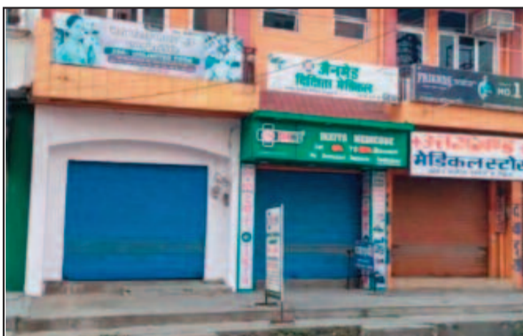
कार्रवाई के विरोध में बंद पड़े कोटद्वार के मेडिकल स्टोर

छापेमारी की इस कार्रवाई से आक्रोशित श्रीनगर व कोटद्वार के मेडिकल स्टोर संचालकों को आक्रोश व्याप्त है। कार्रवाई के विरोध में कोटद्वार में गुरुवार दोपहर बाद अधिकांश मेडिकल स्टोर बंद कर दिए गए।