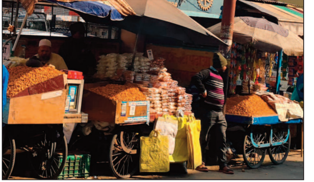
कोटद्वार के स्टेशन रोड में यात्री शेड पर लगी रेहड़ी-टेली

कोटद्वार स्टेशन में यात्री सड़क किनारे खड़े होकर भी बस का इंतजार नहीं कर सकता। हालत यह है कि रेहड़ी-टेली व अन्य व्यापारियों ने सड़क किनारे भी अपना कब्जा जमाया हुआ है। स्टेशन में फैली अव्यवस्थाओं के कारण यात्रियों को हर समय दुर्घटनाओं का अंदेशा बना रहता है। यहीं नहीं पूर्व में कई बार हादसे भी हो चुके हैं।