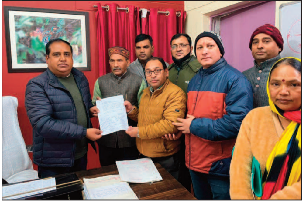
उपजिलाधिकारी के माध्यम से शासन को पत्र भेजते अधिवक्ता