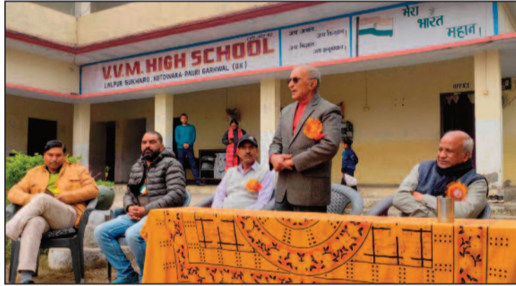
स्वयं सेवियों को संबोधित करते अतिथि