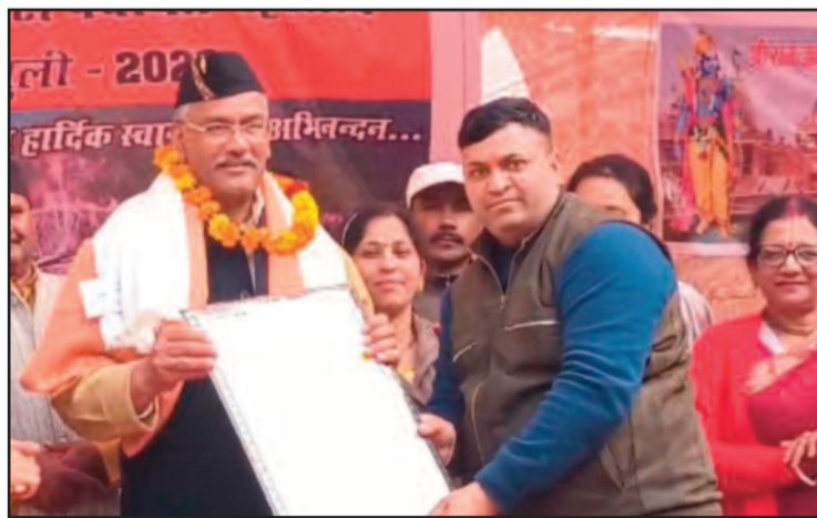
सतपुली में आयोजित कार्यक्रम में मुख्य अतिथि का स्वागत करते सदस्य