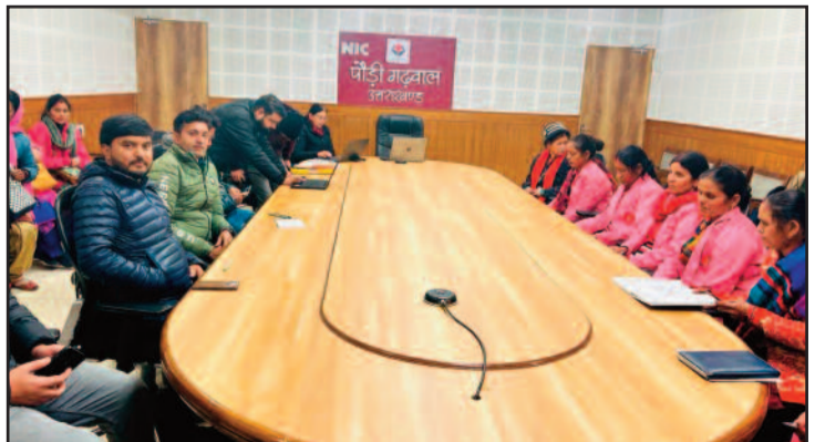
बैठक में उपस्थित अधिकारी, ब्लॉक कार्डिनेटर, आशा कार्यकर्त्रियां।

शनिवार को जिलाधिकारी ने लिंगानुपात को लेकर संबंधित अधिकारियों के साथ बैठक कर आवश्यक दिशा-निर्देश दिये हैं। उन्होंने कहा कि जिन गांवों में लिंगानुपात में भारी गिरावट पाई गई है वहां पुनः जांच कर आख्या प्रस्तुत करना सुनिश्चित करें। गर्भधारण पूर्व व प्रसव पूर्व निदान तकनीक अधिनियम 1994 के अंतर्गत लिंगानुपात