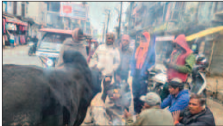
कोटद्वार के झंडाचौक में ठंड से बचने के लिए अलाव का सहारा लेते श्रमिक

धूप के दर्शन नहीं होने से आमजन की मुसीबतें बढ़ गईं। साथ ही सुबह कोहरे के साथ शीत हवाएं चलने से भी लोग हलकान रहे। लोगों ने अपने-अपने घरों में रहना ही मुनासिब समझा। हालांकि नगर निगम प्रशासन की ओर से विभिन्न स्थानों पर