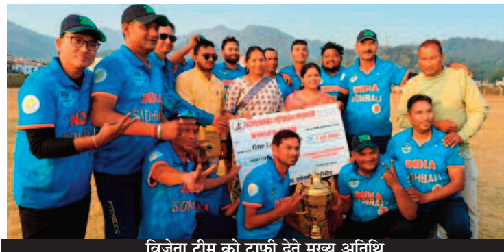
विजेता टीम को ट्राफी देते मुख्य अतिथि