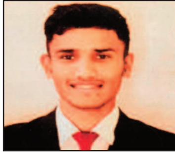
आईएचएमएस का छात्र उत्तम

वर्ष संस्थान परिसर में 18 नवंबर को इंटरव्यू हुआ था।