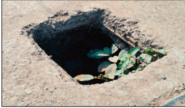
कोटद्वार के सिताबपुर वार्ड नंबर-16 में क्षतिग्रस्त पड़ा चैंबर