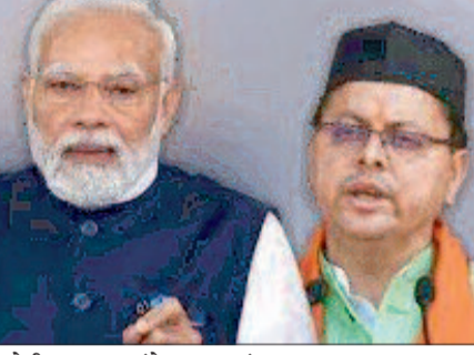
जानेंगे। उत्तराखंड सरकार द्वारा इस बार ग्लोबल इन्वेस्टर्स समिट की थीम 'हूपीस टू प्रोस्पेरिटी' को रखा गया है। मुख्यमंत्री

देहरादून। प्रधानमंत्री नरेंद्र मोदी आगामी 8 दिसंबर को उत्तराखंड ग्लोबल इन्वेस्टर्स समिट 2023 का शुभारंभ करेंगे। 8 और 9 दिसंबर को फारिस्ट रिसर्च इंस्टीट्यूट देहरादून में चलने वाले इस ग्लोबल इन्वेस्टर्स समिट में देश-दुनिया के हजारों से अधिक इन्वेस्टर और डेल्गिगट्स शामिल होंगे। प्रधानमंत्री नरेंद्र मोदी 8 दिसंबर को ही ग्लोबल इन्वेस्टर्स समिट के उद्घाटन सत्र के बाद वापस दिल्ली लौट