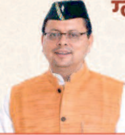
पुष्कर सिंह धामी मुख्यमंत्री, उत्तराखण्ड