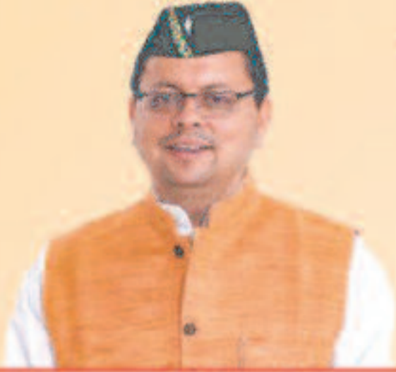
पुष्कर सिंह धामी मुख्यमंत्री, उत्तराखण्ड