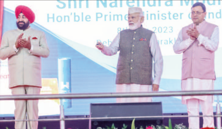
उन्होंने कहा कि उत्तराखंड सहित भारत का हर राज्य इस जगह दिखाई दे रहे हैं। राज्य सरकार जहां स्थानीय वास्तविकताओं को ध्यान में रखते हुए काम कर रही है, वहीं भारत सरकार उत्तराखंड में अभूतपूर्व निवेश कर रही है।

उत्तराखंड के साथ अपने घनिष्ठ संबंध को दोहराते हुए प्रधानमंत्री ने कहा कि उत्तराखंड एक ऐसा राज्य है जहां दिव्यता और विकास एक साथ महसूस होता है। प्रधानमंत्री ने इस भावना को और विस्तार देने के लिए अपनी एक कविता सुनाई। इस अवसर पर उद्घाटित निवेशकों को उद्योग के दिग्गजों के रूप में संदर्भित करते हुए, प्रधानमंत्री ने बहुराष्ट्रीय कंपनियों द्वारा किए गए रहड्ड विक्षेपण की उपमा दी और राष्ट्र पर इस अभ्यास को करने पर जोर दिया। उन्होंने इस बात पर प्रकाश डाला कि रहड्ड विक्षेपण के परिणाम देश में आकांक्षाओं, आशा, आत्मविश्वास, नवाचार और अवसरों की प्रचुरता का संकेत देंगे। उन्होंने नीति-संचालित शासन के संकेतकों और राजनीतिक स्थिरता के लिए नागरिकों के संकल्प का भी उल्लेख किया। प्रधानमंत्री ने हाल ही में संपन्न विधानसभा चुनावों पर प्रकाश डालते हुए कहा, ह्याकांक्षी भारत, अस्थिरता के बजाय एक स्थिर सरकार चाहता है। और रेखांकित किया कि लोगों ने सुशासन और उसके ट्रेक रिकॉर्ड के आधार पर मतदान किया। प्रधानमंत्री मोदी ने कोविड महामारी और अस्थिर भू-राजनीतिक परिदृश्य के बावजूद रिकॉर्ड गति से आगे बढ़ने की देश की क्षमता पर प्रकाश डाला। प्रधानमंत्री ने टिप्पणी की, चाहे वह कोरोना वैक्सीन हो या आर्थिक नीतियां, भारत को अपनी क्षमताओं और नीतियों पर भरोसा था। परिणामस्वरूप, दुनिया की अन्य बड़ी अर्थव्यवस्थाओं की तुलना में भारत आगे खड़ा है।