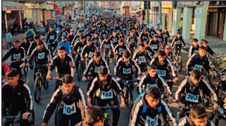
स्वच्छता जागरूकता को लेकर साइकिल रैली निकालते विद्यार्थी