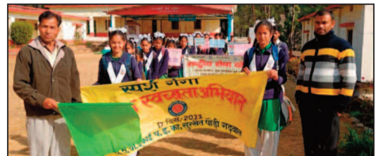
स्वच्छता रैली निकालते सुरखेत के विद्यार्थी