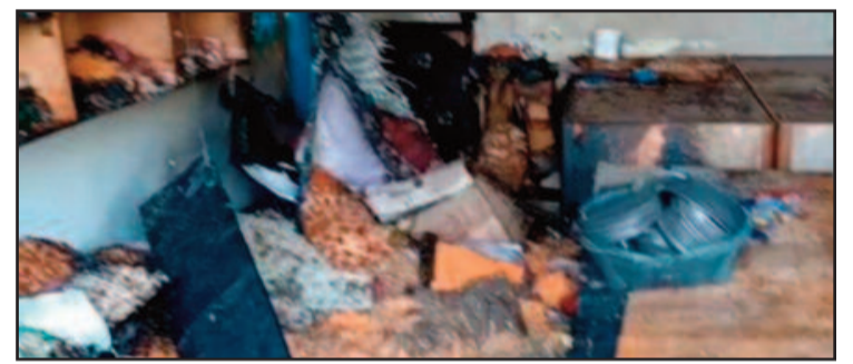
भाबर क्षेत्र के अंतर्गत लोकमणीपुर में आग लगने से खाक हुआ दुकान में रखा सामान