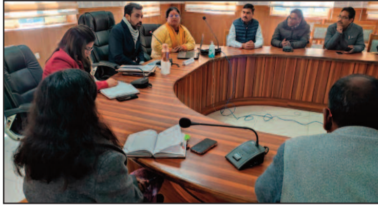
डीएम डॉ. आशीष चौहान बैठक में अधिकारियों को निर्देश देते हुए।

कलेक्ट्रेट सभागार में आयोजित बैठक में राजनीतिक पदाधिकारियों के साथ 14