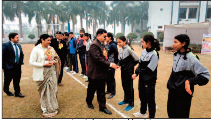
खिलाड़ियों का परिचय लेते अतिथि