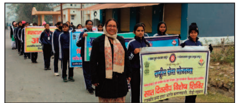
जागरूकता रैली निकालते स्वयं सेवी