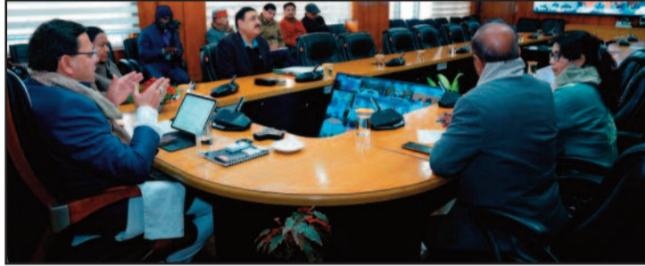
सीएम पुष्कर सिंह धामी बैठक में अधिकारियों को निर्देश देते हुए।

प्रधानमंत्री नरेन्द्र मोदी ने एक सौ चालीस करोड़ देशवासियों को रामोत्सव मनाने का सुअवसर प्रदान किया है। भगवान श्री राम