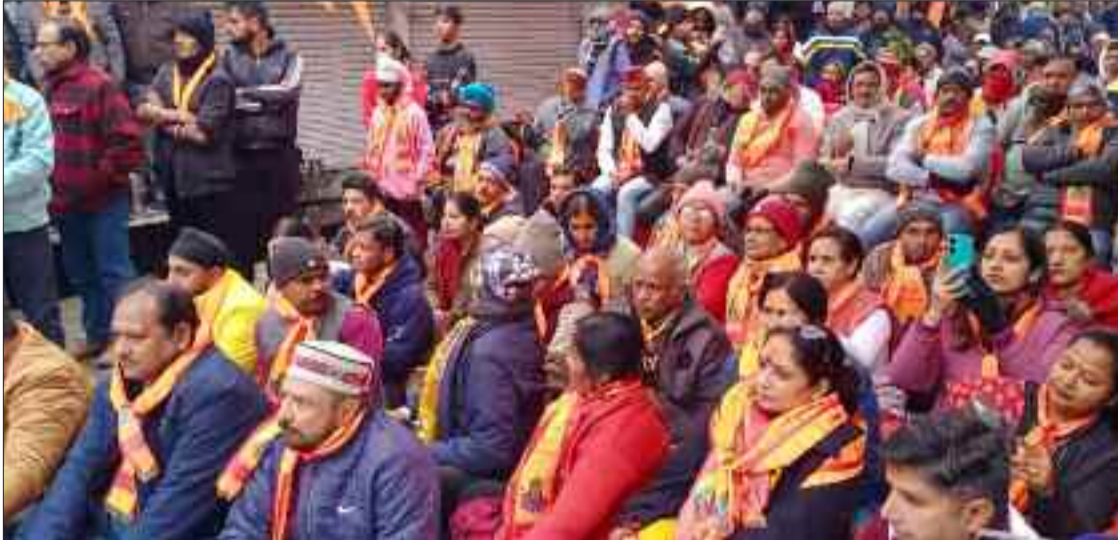
अयोध्या में रामलला की प्राण-प्रतिष्ठा को विधानसभा अध्यक्ष ऋतु खंडूरी भूषण राम भक्तों के साथ लाइव देखते हुए।

जयन्त प्रतिनिधि। कोटद्वार : अयोध्या में राम मंदिर प्राण प्रतिष्ठा समारोह के दौरान कोटद्वार में जबरदस्त उत्साह देखने को मिला। मंदिरों में विशेष पूजा-अर्चना का आयोजन हुआ तो कई जगह भंडारे का आयोजन भी हुआ। शहर में माहौल से दिवाली सा प्रतीत हो रहा है। शहर जय श्री