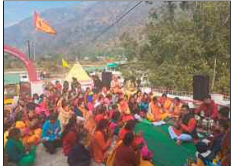
मां भुवनेश्वरी मंदिर सांगुडा, बिलखेत में महिलाएं कीर्तन करते हुए।