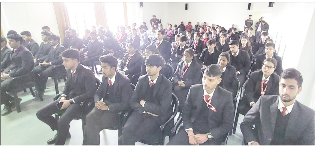
प्रधानमंत्री के संवाद कार्यक्रम को सुनते विद्यार्थी