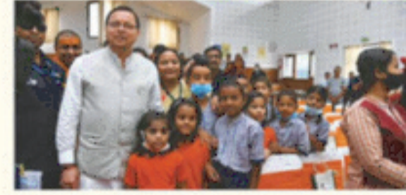
राजकीय विद्यालयों के साथ राजकीय सहायता प्राप्त (अशासकीय) विद्यालयों में कक्षा 1 से 12 तक के छात्र-छात्राओं को निःशुल्क पाठ्य पुस्तकें।