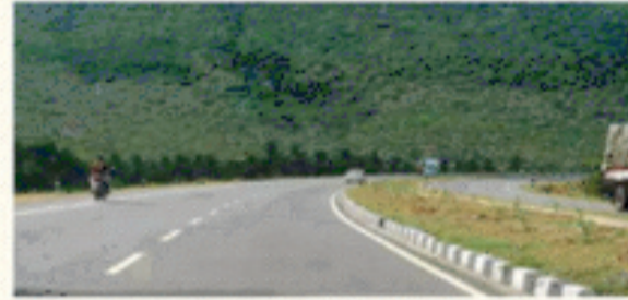
रोड कनेक्टिविटी : चारधाम ऑल वेदर रोड, दिल्ली-देहरादून एलिवेटेड रोड व अन्य राष्ट्रीय राजमार्गों का विकास।