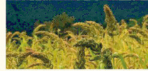
स्टेट मिलेट मिशन में स्थानीय कृषकों से झंगोटा, मंडुवा, सोयाबीन एवं चौलाई का उचित मूल्य पर क्रय।