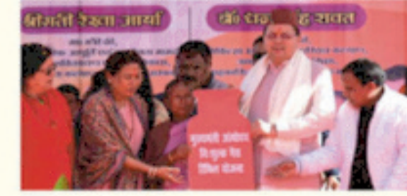
अन्योदय निःशुल्क गैस टिफिल योजना के तहत वर्ष में 3 गैस सिलिण्डर टिफिल मुफ्त।