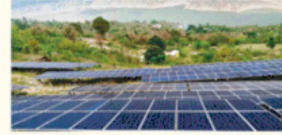
राज्य में सोलर पॉवर उत्पादन को प्रोत्साहित करने हेतु नई सौर ऊर्जा नीति लागू।