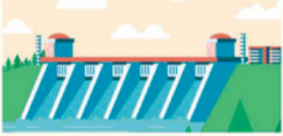
जमतानी बांध परियोजना को केन्द्रीय कैबिनेट की आर्थिक मामलों की कमेटी ने दी मंजूरी।