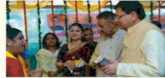
मुख्यमंत्री सशक्त बहना उत्सव योजना के तहत महिला समूहों द्वारा निर्मित उत्पादों को प्रोत्साहन।