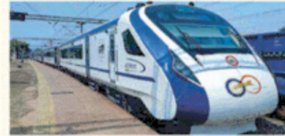
रेल कनेक्टिविटी : ऋषिकेश-कर्णप्रयाग रेल परियोजना, वन्देभारत एक्सप्रेस ट्रेन, टनकपुर बागेश्वर रेल लाईन।