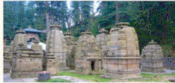
मानसखण्ड मंदिर माला मिशन।