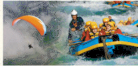
पर्यटन मंत्रालय भारत सरकार द्वारा उत्तराखण्ड को बेस्ट एडवेंचर टूरिज्म डेस्टिनेशन का अवार्ड।