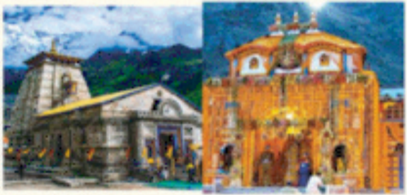
केदारनाथ बदरीनाथ धाम में 1300 करोड़ रुपये के पुनर्निर्माण/पुनर्विकास कार्य, चारधाम यात्रा के दौरान रिकॉर्ड 55 लाख से अधिक श्रद्धालुओं ने किये दर्शन।