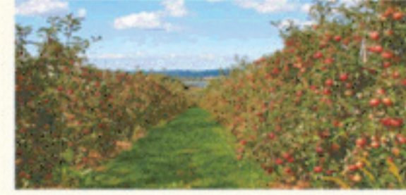
मिशन एप्पल के तहत राज्य में सेब के 500 बगीचों की स्थापना का लक्ष्य है। मिशन एप्पल का बजट दुगुना।