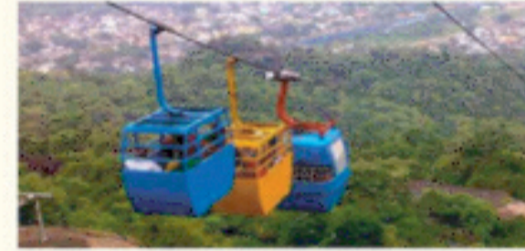
टोप-वे कनेक्टिविटी : पर्वतमाला परियोजना, गौरीकुण्ड-केदारनाथ टोप-वे कनेक्टिविटी, गोविन्द घाट-टैमकुण्ड, सुटकण्डा देवी टोप-वे।