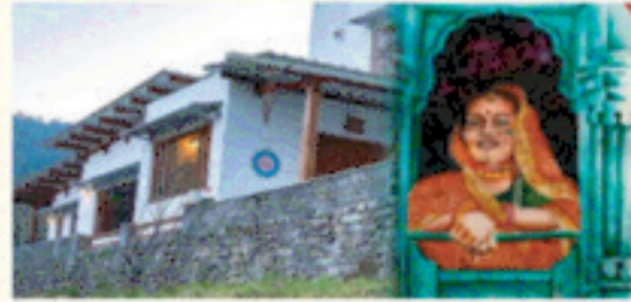
4000 से अधिक होम-स्टे विकसित, 16 ईको टूरिज्म डेस्टिनेशन का विकास।