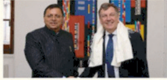
ग्लोबल इन्वेस्टर समिट 2023 के लिये 3.5 लाख करोड़ रुपये से अधिक के एमओयू।