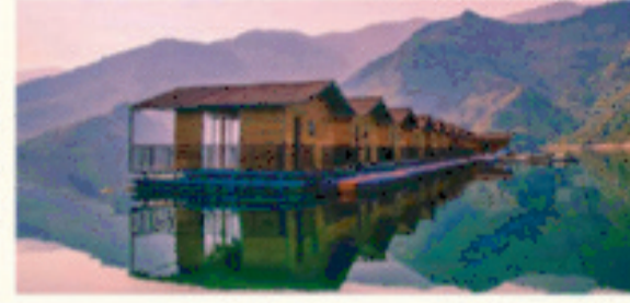
2 हजार करोड़ रुपये की लागत से टिहरी लेक डेवलपमेंट।