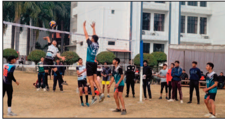
आयोजित प्रतियोगिता में प्रतिभाग करते खिलाड़ी

बालक वर्ग का उद्घाटन मैच डेफोडिल और महर्षि विद्यामंदिर के बीच खेला गया। जिसमें डेफोडिल ने मैच अपने नाम किया। इसके बाद आयोजित लीग मैच में नवयुग-