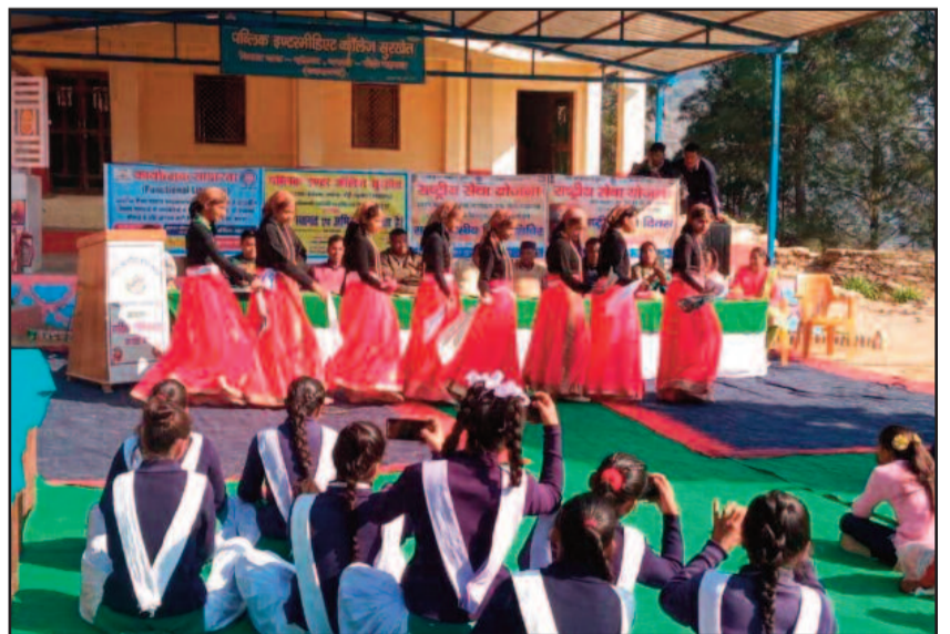
आयोजित एनएसएस शिविर में भाग लेते स्वयं सेवी