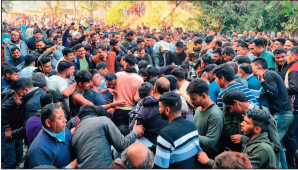
डाडामंडी में गेंद के लिए जूझते कौथिगेर,

मवाकोट व डाडामंडी में आयोजित किया गया गेंद मेला