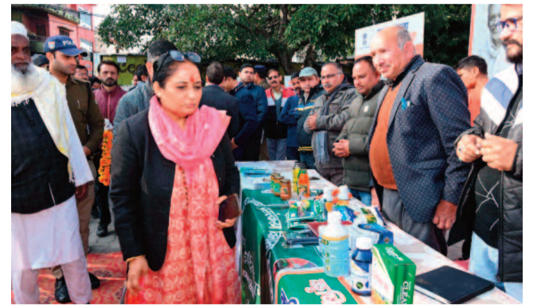
कार्यक्रम के दौरान लगाए गए स्टॉल की जानकारी लेती विस अध्यक्ष

संवाद समाप्त होने के बाद विधानसभा अध्यक्ष ने कार्यक्रम में उपस्थित बोकसा समुदाय के जनमानस को आश्वासन दिया कि वे आगामी 19 जनवरी को सरकारी अमले के साथ बोकसा जनजाति बाहुल्य क्षेत्र में जाकर लोगों की समस्याओं की