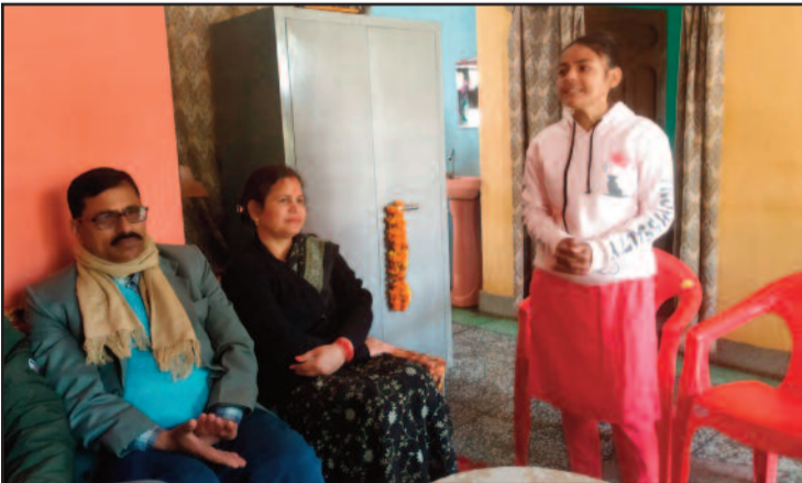
मकर संक्रांति पर कविता प्रस्तुत करती छात्रा