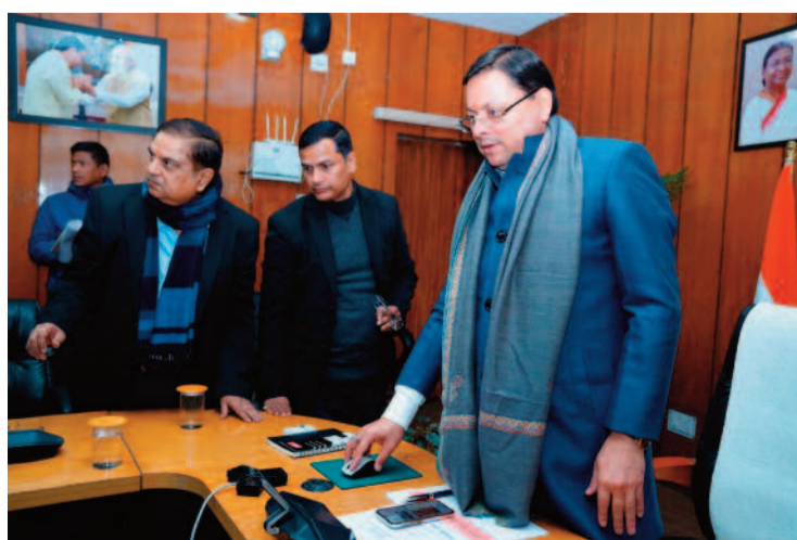
ऑनलाइन आर.टी.आई. हार्डब्रिड सुनवाई की व्यवस्था का शुभारंभ करते हुए सीएम पुष्कर सिंह धामी।