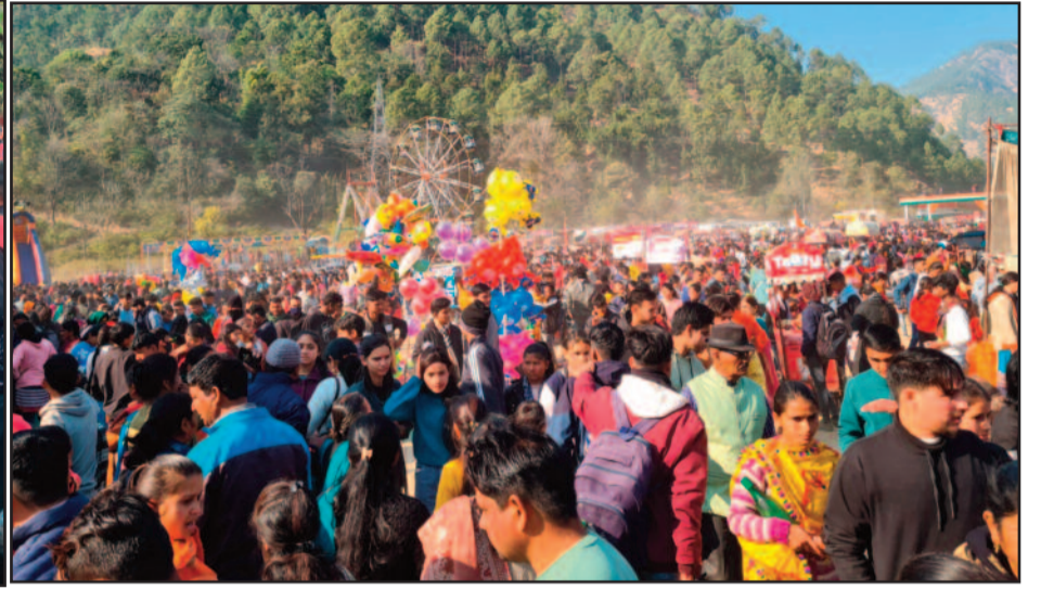
डाडामंडी मेले में उमड़ी लोगों की भीड़