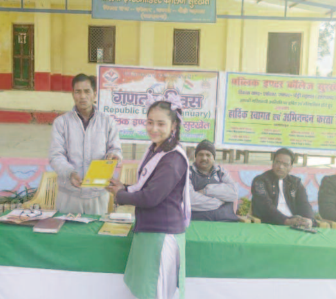
पब्लिक इंटर कालेज सुरखेत में विद्यार्थियों को सम्मानित करते शिक्षक