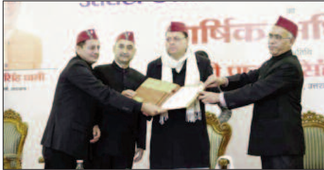
सीएम पुकर सिंह थाकुरी ने उत्तराखण्ड प्रांतीय सिविल सेवा संघ के पदाधिकारी मांग पत्र सौंपते हुए।