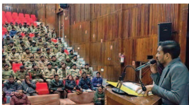
डीएम डॉ. आशीष चौहान प्रशिक्षण कार्यक्रम को संबोधित करते हुए।

पौड़ी : जनपद के संस्कृति भवन (प्रेक्षागृह) में मंगलवार को जनपद में निर्वाचन ड्यूटी के संपादन हेतु तैनात किये गये सैक्टर मजिस्ट्रेट (सामान्य और पुलिस मजिस्ट्रेट) का प्रशिक्षण कार्यक्रम संपन्न हुआ। मंगलवार को 120 सैक्टर मजिस्ट्रेट का प्रशिक्षण कार्यक्रम था, जिसमें से कुल 110 उपस्थित रहे तथा 10 अनुपस्थित रहे। जिलाधिकारी ने अनुपस्थित रहे सैक्टर मजिस्ट्रेट के संबंध में निर्देश दिये हैं कि उनका तत्काल स्पष्टीकरण लिया जाय। कहा कि बिना वाजिब कारण के चलते कोई अनुपस्थित पाया जाता है तो उसके विरुद्ध जनप्रतिनिधित्व अधिनियम की सुसंगत धाराओं के अंतर्गत कार्यवाही की जायेगी। कहा कि निर्वाचन के कार्यों में अनुशासन से किसी भी तरह का समझौता नहीं किया जायेगा।