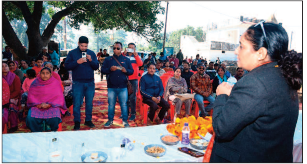
भूमि पूजन के दौरान जनता को संबोधित करते विधानसभा अध्यक्ष

इससे क्षेत्रवासियों को सिंचाई के लिए पानी उपलब्ध नहीं हो पा रहा था। विधानसभा अध्यक्ष ने अधिकारियों को युद्ध स्तर पर नहर मरम्मत का प्रस्ताव बनाने और शासन को भेजने के निर्देश दिए थे जिस पर शासन द्वारा नहर के जीर्णोद्धार हेतु 490.77 लाख की लागत स्वीकृत की गई। विधानसभा अध्यक्ष ने कहा कि कोटद्वार में सिंचाई नहरों की जीर्ण शीर्ष स्थिति से वे अवगत हैं और उन्होंने नहरों के जीर्णोद्धार करने का जिम्मा उठाया है। नहरों के जीर्णोद्धार से किसानों को सिंचाई हेतु पर्याप्त मात्रा में पानी उपलब्ध हो