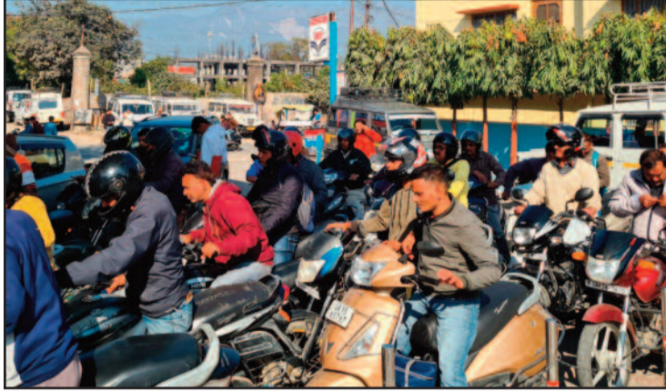
कोटद्वार के देवी रोड स्थित पेट्रोल पंप पर तेल भरवाने के लिए लगी लंबी कतार

हिट एंड रन कानून में सजा के प्रवधान को कड़ा बनाने पर पिछले तीन दिन से वाहनों की हड़ताल चल रही है। जिसके कारण शहर में डीजल-पेट्रोल के टैंकर