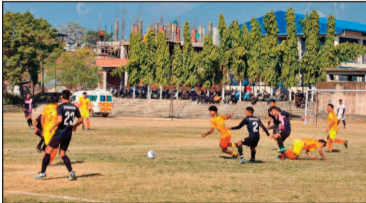
राजकीय स्पोर्ट्स स्टेडियम में गोल के लिए जूझते खिलाड़ी