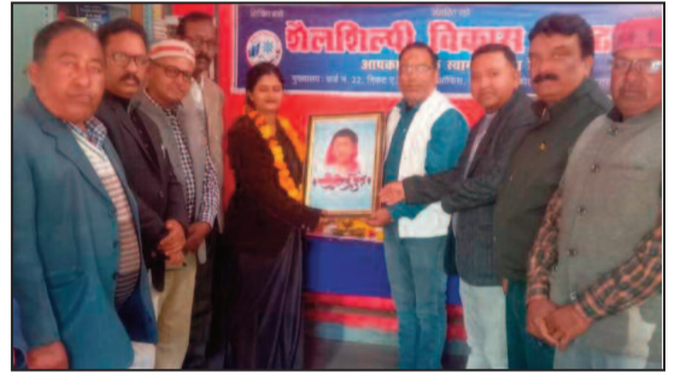
सावित्रीबाई फुले को याद करते संगठन के सदस्य।