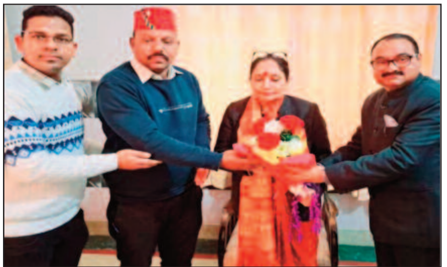
समस्या के निराकरण को लेकर विधानसभा अध्यक्ष से मिलते एसोसिएशन के सदस्य

ज्ञापन में कहा गया है वर्तमान में प्राथमिक से उच्च शिक्षा तक अनुसूचित जाति-जनजाति के छात्र-छात्राओं की वर्ष 2023-24 हेतु छात्रवृत्ति आनलाइन प्रक्रिया बाधित चल रही है। इस कारण आवेदन करने वाले छात्र-छात्राओं को परेशानी का सामना करना पड़ रहा है। इस संबंध में शिक्षा विभाग एवं समाज कल्याण विभाग की ओर से स्पष्ट