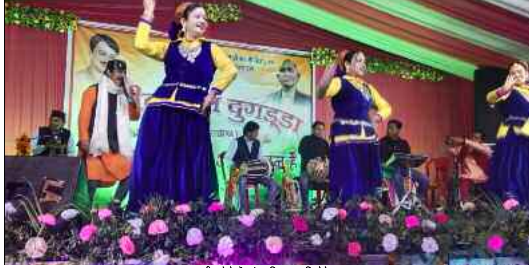
दुग्डु शहीद मेले में सांस्कृतिक प्रस्तुति देते कलाकार

जयन्त प्रतिनिधि। कोटद्वार : शहीद मेले में कलाकारों की प्रस्तुतियों ने दर्शकों को मंत्रमुग्ध कर दिया। देर शाम तक दर्शक लोक गायकों के मधुर गीतों पर झुमे हुए नजर आए। इस दौरान विद्यार्थियों के लिए भी विभिन्न सांस्कृतिक कार्यक्रम आयोजित किए गए।