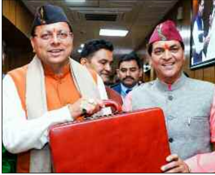
मुख्यमंत्री ने कहा कि नीति आयोग द्वारा जारी बहुआयामी गरीबी सुचकांक के अनुसार प्रदेश के 9 लाख 17 हजार 299 लोग गरीबी रेखा से बाहर आए हैं।

देहरादून। मुख्यमंत्री पुष्कर सिंह धामी ने मंगलवार को उत्तराखंड विधानसभा में प्रस्तुत बजट को समग्र, समावेशी, संतुलित और विकासोन्मुखी बताया है। मुख्यमंत्री ने कहा कि प्रधानमंत्री जी ने विकसित भारत के चार स्तंभ, गरीब, युवा, महिला और किसान बताए हैं और हमारी सरकार द्वारा आज प्रस्तुत बजट इन्हीं को समर्पित है। मुख्यमंत्री ने कहा कि हमारी सरकार ने वर्ष 2024-25 के लिए 89,230 करोड़ रुपए का बजट प्रस्तुत किया गया जो पिछले वर्ष से 15.27 प्रतिशत अधिक है। मुख्यमंत्री ने कहा कि सशक्त उत्तराखंड के लिए हमारी सरकार विकल्प रहित संकल्प के साथ काम कर रही है। औद्योगिक विकास और रोजगार को बढ़ावा देने के लिए हमारी सरकार ने 30 से अधिक नीतियां बनाई हैं और इसके सकारात्मक प्रभाव भी देखने को मिल रहे हैं।