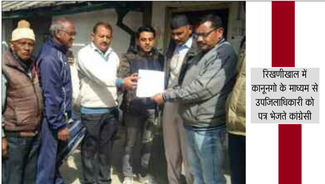
रिखणीखाल में कानूनगो के माध्यम से उपजिलाधिकारी को पत्र भेजते कांग्रेसी

जयन्त प्रतिनिधि। कोटद्वार : रिखणीखाल उपतहसील में प्रमाण पत्रों पर तहसीलदार के डिजिटल हस्ताक्षर नहीं होने पर कांग्रेस ने रोष व्यक्त किया है।