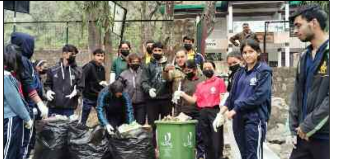
कोटद्वार में स्वच्छता अभियान चलाते आईएचएमएस के विद्यार्थी

जयन्त प्रतिनिधि। कोटद्वार : इंस्टीट्यूट ऑफ हास्पिटैलिटी मैनेजमेंट एंड सॉसेज (आईएचएमएस) के मैनेजमेंट विभाग की ओर से स्वच्छता कार्यक्रम चलाया गया। जिसमें छात्र-छात्राओं ने कोटद्वार के प्रसिद्ध श्री सिद्धबली मंदिर परिसर और कावेर टाइगर रिजर्व के सार्वजनिक पार्क में सफाई अभियान चलाया।