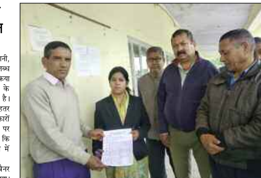
समस्या को लेकर प्रशासन को ज्ञापन देते काश्तकार

जयन्त प्रतिनिधि। कोटद्वार : लालपानी, सेनेह क्षेत्र में सिंचाई के लिए पानी उपलब्ध नहीं होने पर काश्तकारों ने रोष व्यक्त किया है। कहा कि शासन-प्रशासन काश्तकारों के हितों को लेकर लापरवाह बना हुआ है। शिकायत के बाद भी व्यवस्थाओं को बेहतर बनाने पर ध्यान नहीं दिया जा रहा। काश्तकारों ने जल्द समस्या का निराकरण नहीं होने पर आंदोलन की चेतावनी दी है। कहा कि काश्तकारों की अनदेखी किसी भी हाल में बर्दाश्त नहीं की जाएगी।