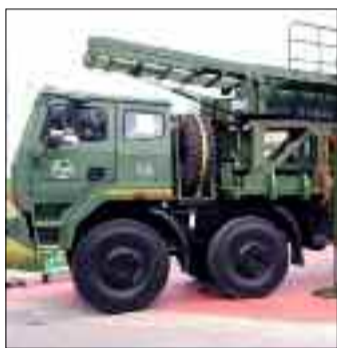
अगले 4 सालों में कुल 41 सेट किए जाएंगे शामिल एक वरिष्ठ अधिकारी के मुताबिक, अगले 4 सालों में कुल 41 सेट धीरे-धीरे शामिल किए जाएंगे, जिनकी कीमत 2,585 करोड़ रुपये होगी। पहला सेट आज यानी मंगलवार को सेना में शामिल किया गया।

नई दिल्ली। भारतीय सेना में मॉड्यूलर ब्रिज को शामिल किया गया। मॉड्यूलर ब्रिज को शामिल किए जाने से सेना को किसी भी चुनौतीपूर्ण जगहों पर अपने टैंकों को तैनात करने में आसानी होगी। साथ ही सेना के इंजीनियरों की महत्वपूर्ण ब्रिजिंग क्षमता को बढ़ाएगा। नई दिल्ली स्थित मानेकशा सेंटर में आयोजित हुए कार्यक्रम भारतीय सेना ने मंगलवार को 46-मीटर मॉड्यूलर ब्रिज को शामिल करके अपनी ब्रिजिंग क्षमता को बढ़ाया है। इस मॉड्यूलर ब्रिज को डीआरडीओ ने लासॉन एंड टुब्रो के साथ मिलकर डिजाइन और विकसित किया है। इस कार्यक्रम में भारतीय सेना प्रमुख जनरल मनोज पांडे, सीडीएस जनरल अनिल चौहान, सेना, डीआरडीओ और रक्षा मंत्रालय के कई वरिष्ठ अधिकारी और लासॉन एंड टुब्रो (एलएंडटी) के वरिष्ठ अधिकारी शामिल हुए।