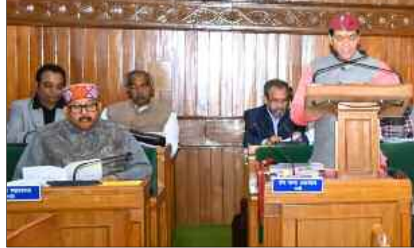
में विकसित की जाने के सवाल पर पर्यटन मंत्री महाराज ने सदन को बताया कि जिला योजना 2024-25 के अंतर्गत नानक सागर डैम