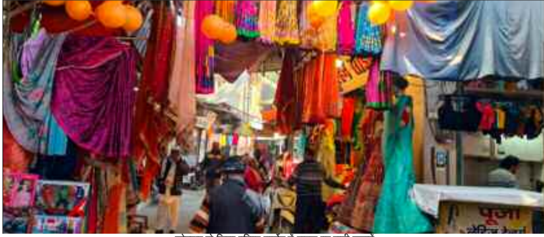
कोटद्वार के जिला परिषद मार्केट में सड़क पर सजी दुकानें

जयन्त प्रतिनिधि। कोटद्वार : एक ओर जहां अतिक्रमण शहरवासियों के लिए नासूर बनता जा रहा है। वहीं, सरकारी सिस्टम भी इस समस्या को लेकर लापरवाह बना हुआ है। हालत यह है कि दिसंबर माह में जिला पंचायत