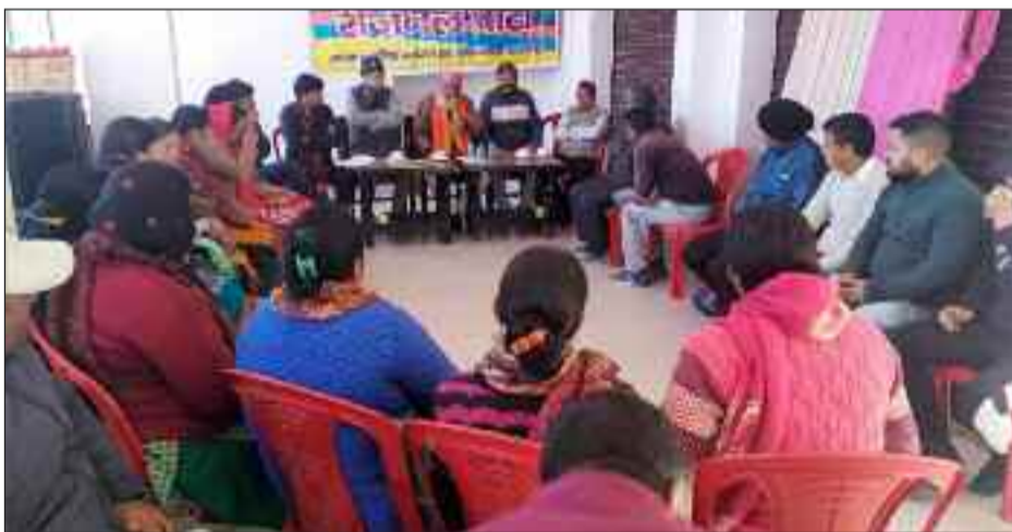
कहा कि क्षेत्रीय मुद्दों को सरकार तक पहुंचाने एवं उनके निवारण के लिए जल्द ही

रुद्रप्रयाग : सड़क की मांग को लेकर लुठियाग के ग्रामीणों ने क्रमिक अनशन दूसरे दिन भी जारी रखा। ग्रामीणों का कहना है कि जब तक उनकी मांग पूरी नहीं हुई आंदोलन जारी रहेगा। साथ ही उन्होंने 6 फरवरी को चिरबिटिया में चक्काजाम की चेतावनी दी है। ग्रामीणों ने कहा कि ग्राम पंचायत में 450 परिवार हैं, जिसकी आबादी करीब 1600 है। सड़क सुविधा नहीं होने से स्वास्थ्य केन्द्र के लिए कई किमी पैदल चलना पड़ता है। जखोली ब्लॉक के लुठियाग के ग्रामीणों का चिरबिटिया पंचायत भवन में चल रहा क्रमिक अनशन दूसरे दिन भी जारी रहा। वक्ताओं ने कहा कि ग्रामीण बीते 18 वर्षों से गांव को सड़क की मांग करते आ रहे हैं, किंतु अभी तक कोई सकारात्मक कार्यवाही नहीं हुई है