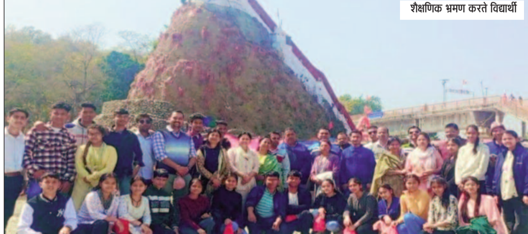
शैक्षणिक भ्रमण करते विद्यार्थी

जयन्त प्रतिनिधि। कोटद्वार: जानकी नगर स्थित रिशे शर्मा सरस्वती विद्या मंदिर इंटर कॉलेज के छात्रों का एक दिवसीय शैक्षणिक भ्रमण कार्यक्रम आयोजित किया गया। इस दौरान विद्यालय के छात्रों ने उत्तराखंड के रामनगर स्थित उत्तराखंड शिक्षा एवं परीक्षा कार्यालय, कार्बेट नेशनल पार्क व गर्जिया माता मंदिर का भ्रमण किया।