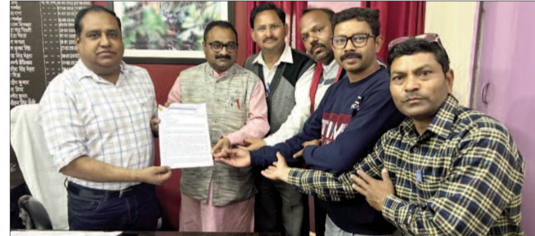
उपजिलाधिकारी के माध्यम से मुख्यमंत्री को ज्ञापन भेजते एसोसिएशन के सदस्य

बताया कि लोक सेवा आयोग उत्तराखंड द्वारा प्रधानाचार्य के 692 पदों का विज्ञापन जारी किया गया है। शिक्षक एसोसिएशन पूर्व से ही इन पदों पर पूर्व की भांति शत प्रतिशत विभागीय पदोन्नति की मांग करते आ रहा है। कहा कि उत्तराखंड बनने के बाद प्रधानाचार्य पदों पर यह पहली विभागीय सीधी भर्ती है।