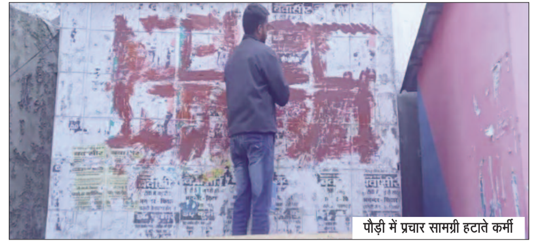
पौड़ी में प्रचार सामग्री हटाते कर्मी