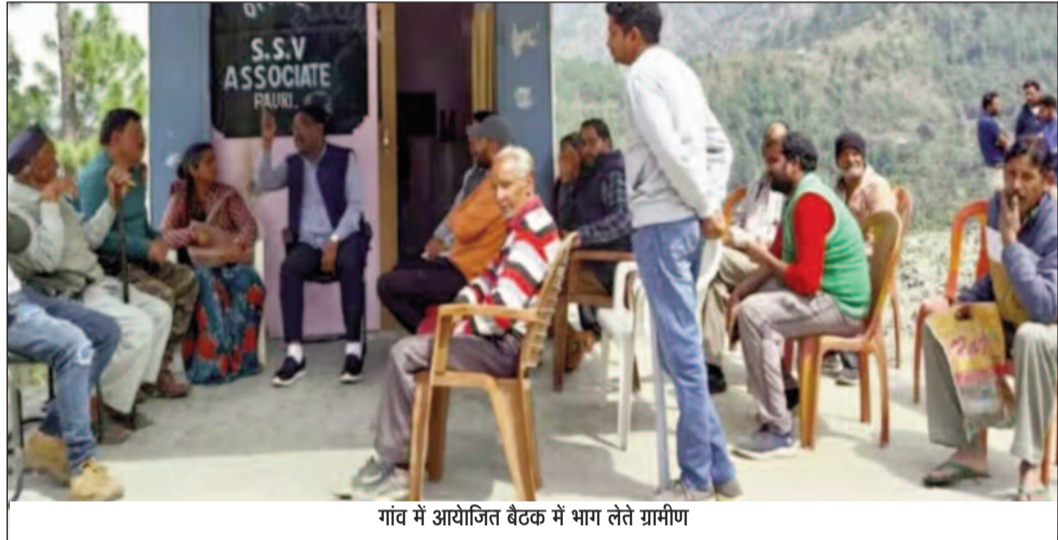
गांव में आयोजित बैठक में भाग लेते ग्रामीण

जयन्त प्रतिनिधि। पौड़ी: शहर से सटे गड़ोली गांव के ग्रामीणों ने लोकसभा चुनाव के बहिष्कार की चेतावनी दी है। ग्रामीणों का कहना है कि शहर से सटे होने के बाद भी गांव में कई समस्याएं बनी हैं लेकिन आज तक समस्याओं के