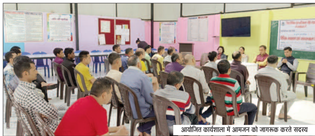
आयोजित कार्यशाला में आमजन को जागरूक करते सदस्य