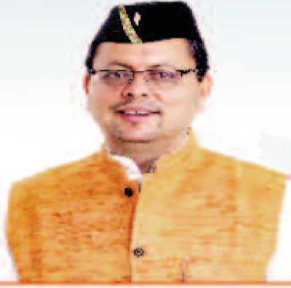
पुष्कर सिंह धामी मुख्यमंत्री, उत्तराखण्ड