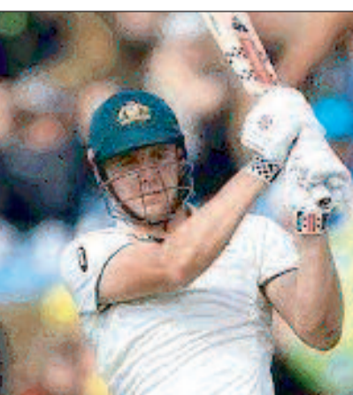
टीम की पारी खत्म करना चाहती थी। हालांकि, उन्होंने जैसे सोचा था वैसा हुआ नहीं और हेजलवुड के साथ ग्रीन ने 116 रन की रिकॉर्ड साझेदारी निभाई। ग्रीन ने 275 गेंद का सामना किया और नाबाद 174 रन बनाए। उनके बल्ले से 23 चौके और 5 छक्के निकले। हेजलवुड

नईदिल्ली, ऑस्ट्रेलिया क्रिकेट टीम के स्टार ऑलराउंडर खिलाड़ी कैमरून ग्रीन ने न्यूजीलैंड क्रिकेट टीम के खिलाफ पहले टेस्ट मैच में 174* रन की शानदार पारी खेली। उन्होंने आखिरी विकेट के लिए जोश हेजलवुड के साथ 116 रन जोड़े। इसी के कारण कंगारू टीम ने पहली पारी में 383 रन बनाते में सफल रही। पारी के अलावा कोई ऑस्ट्रेलियाई बल्लेबाज 45 रन भी नहीं बना पाया। ऐसे में आइए उनकी पारी और रिकॉर्ड्स पर एक नजर डालते हैं। ऑस्ट्रेलिया ने पहले विकेट के लिए 61 रन जोड़े थे। इसके बाद टीम के 4 बल्लेबाज सिर्फ 89 रन तक पवेलियन लौट गए। ग्रीन जो नंबर-4 पर बल्लेबाजी करने आए थे उन्होंने मिचेल मार्श (40) के साथ 67 रन की साझेदारी निभाई। मार्श के आउट होने के बाद भी कंगारू टीम का यह ऑलराउंडर अच्छी बल्लेबाजी करता रहा और टीम को 250 के पार पहुंचाया। पहला दिन समाप्त होने के समय वह 103 रन बनाकर नाबाद वापस लौटे। पहले दिन ऑस्ट्रेलिया के 9 बल्लेबाज पवेलियन लौट गए थे। ऐसे में न्यूजीलैंड की टीम दूसरे दिन जल्द से जल्द कंगारू