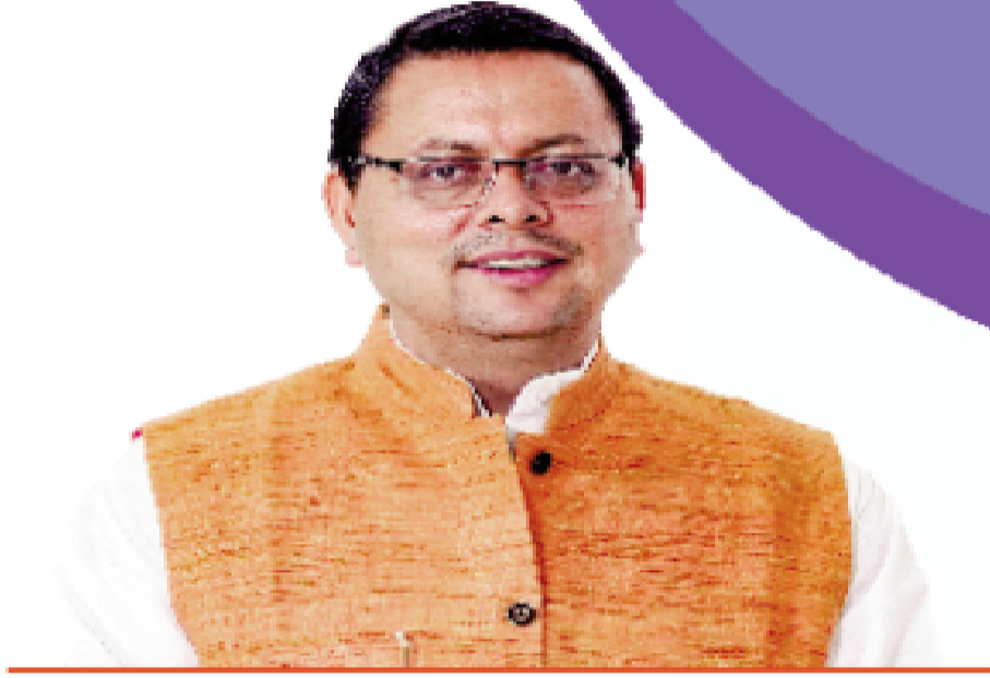
पुष्कर सिंह धामी