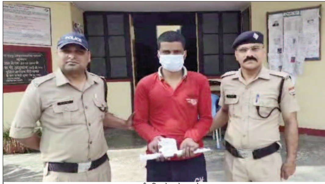
सतपुली पुलिस के हथिये चोरी का वस्तु