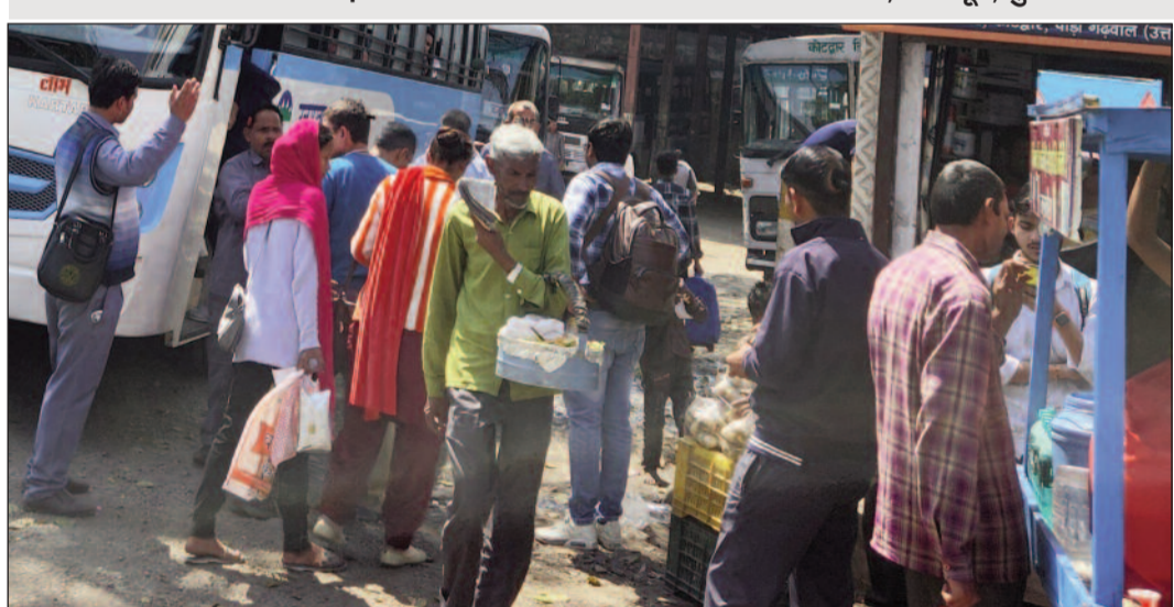
होली त्योहार संपन्न होने के बाद कोटद्वार बस अड्डे में बस का इंतजार करते यात्री

● होली संपन्न होने के बाद बड़ी संख्या में मैदान को लौट रहे प्रवासी ● दिल्ली, देहरादून, गुरग्राम सहित अन्य रूटों पर बढ़ा वाहनों का दबाव