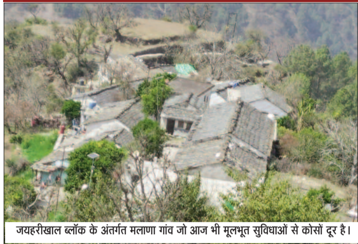
जयहरीखाल ब्लॉक के अंतर्गत मलाणा गांव जो आज भी मूलभूत सुविधाओं से कोसों दूर है।

● राज्य गठन के दशकों बाद भी मूलभूत सुविधाओं से कोसों दूर है मलाणा गांव ● सड़क व स्वास्थ्य सुविधा के अभाव में पलायन को मजबूर ग्रामीण