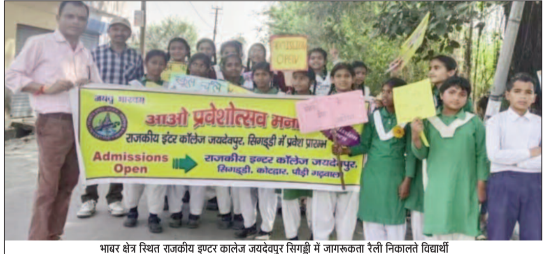
भारत क्षेत्र स्थित राजकीय इण्टर कालेज जयदेवपुर सिगढ़ी में जागरूकता रैली निकालते विद्यार्थी

जयन्त प्रतिनिधि। कोटद्वार : भारते क्षेत्र स्थित राजकीय इण्टर कालेज जयदेवपुर सिगढ़ी के अध्यापकों और छात्रों ने अभिभावकों से अपने बच्चों को सरकारी विद्यालयों में प्रवेश दिलाने की अपील की है। इस संबंध में विद्यालय में सरकारी स्कूलों के प्रति अभिभावकों के घटते रुझान के प्रति अध्यापकों और छात्रों की