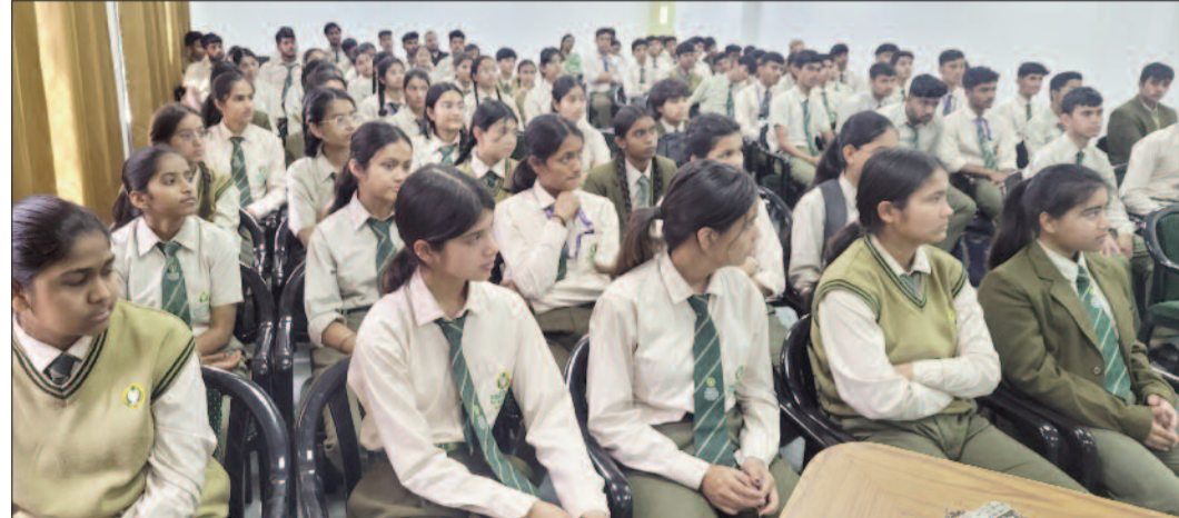
आयोजित कार्यशाला में भाग लेते विद्यार्थी