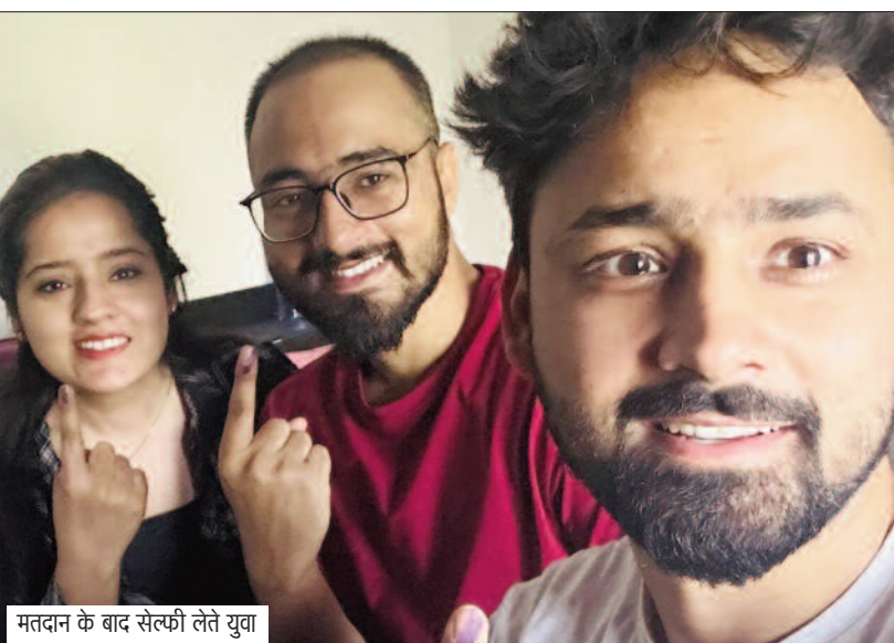
मतदान के बाद सेल्फी लेते युवा

लोगों को मतदान के प्रति जागरूक करने के लिए चुनाव आयोग विशेष अभियान चला रहा था। मत प्रतिशत बढ़ाने के लिए लगातार प्रयास किया जा रहा था। प्रयास रंग लाया तो शुकुवार को