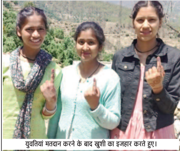
युवतियां मतदान करने के बाद खुशी का इजहार करते हुए।