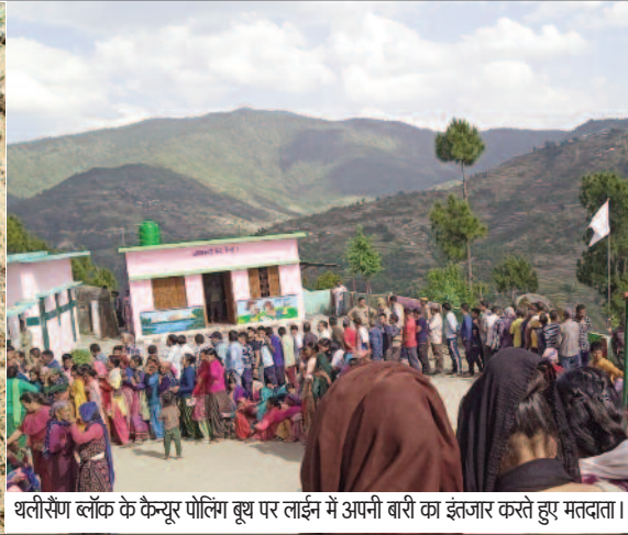
बीबीसेंग बॉक के केन्द्र पोलिंग बूथ पर लाईन में अपनी बारी का इंतजार करते हुए मतदाता।

जयन्त प्रतिनिधि। पौड़ी : पौड़ी गढ़वाल में लोकसभा चुनाव के चलते शुक्रवार को पहले चरण के तहत गढ़वाल लोकसभा क्षेत्र में मतदान हुआ। लोकतंत्र के इस महापर्व को लेकर लोकसभा सीट