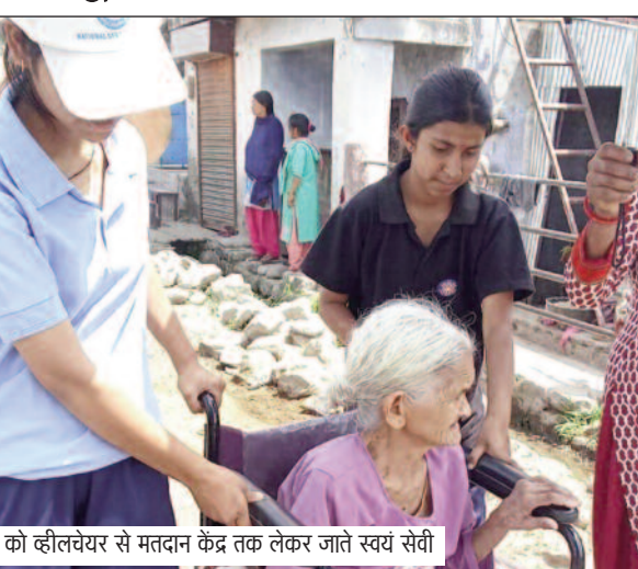
बुजुर्ग महिला को व्हीलचेयर से मतदान केंद्र तक लेकर जाते स्वयं सेवी

जयन्त प्रतिनिधि। कोटद्वार : सुबह मतदान के लिए बड़े उत्साह के साथ घर से निकले थे। लेकिन, जैसे ही मतदान केंद्र में मतदान लिस्ट देखी तो उसमें नाम कहीं दर्ज नहीं था। ऐसे में कई लोग अपने मत का प्रयोग नहीं कर पाए। मतदान से वंचित अधिकांश लोगों ने इसे प्रशासन की लापरवाही बताया। कहा कि आधार कार्ड व अन्य महत्वपूर्ण दस्तावेज देने के बाद