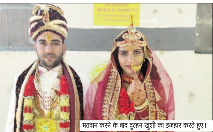
मतदान करने के बाद दुल्हन खुशी का इजहार करते हुए।

जयन्त प्रतिनिधि। पौड़ी : पौड़ी जनपद में कड़ी सुरक्षा के बीच वोटिंग हुई। विधानसभा अध्यक्ष रितु खंडूड़ी भूषण सहित अन्य नेताओं ने मतदान किया। वहीं दुल्हा-दुल्हनों ने अपने मत का प्रयोग करते हुए अपने नव दंपत्य जीवन की शुरुआत की। जगह-जगह से चुनाव की खबरसूरत तस्वीरें भी सामने आ रही हैं। मतदान के दिन दुल्हा व दुल्हनों ने अपने मत का प्रयोग करते हुए अपने नव दंपत्य जीवन की शुरुआत की। मतदान