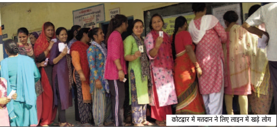
कोटद्वार में मतदान के लिए लाइन में खड़े लोग

जयन्त प्रतिनिधि। कोटद्वार : लोकसभा चुनाव के लिए सुबह सात बजे से मतदान की प्रक्रिया प्रारंभ हो गई थी। सुबह जहां मतदान को लेकर लोगों में खासा उत्साह देखने को मिल रहा था। वहीं, दोपहर बाद यह रफ्तार धीमी पड़ गई। शाम पांच बजे तक गढ़वाल सीट में कुल 48.16 प्रतिशत मतदान हुआ। करीब एक माह तक प्रत्याशियों के मुद्दों व भाषणों को सुनने के बाद शुकुवार को वोटों को मतदान करने का मौका मिला। अपने प्रत्याशी को चुनने के लिए मतदाताओं में काफी उत्साह बना हुआ था। सुबह के समय कई मतदान केंद्रों में लोगों को भीड़ जुटी हुई थी। लेकिन, दिन बढने के साथ ही यह भीड़ कम हो गई। नतीजा दोपहर के बाद अधिकांश मतदान केंद्रों में एक-दो ही मतदाता नजर आ रहे थे। इसका एक प्रमुख कारण