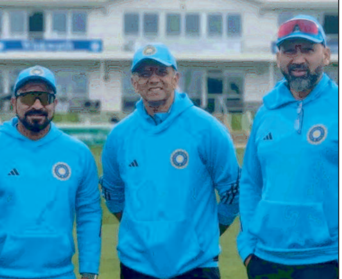
नाम लिया। वहीं, तेज गेंदबाज के रूप में खलील अहमद, मुकेश कुमार, मोहसिन खान और मयंक यादव ( अगर वह फिट हैं तो) का नाम लिया।

नई दिल्ली। भारत की टी20 वर्ल्ड कप टीम को लेकर बहस तेज हो गई है। उस बहस में भारत के पूर्व सलामी बल्लेबाज नवजोत सिंह सिद्धू भी शामिल हो गए हैं। आईपीएल के मैच के दौरान कमेंट्री करते हुए उन्होंने भारतीय टीम के मुख्य कोच राहुल द्रविड़ को एक खास सलाह दी। सिद्धू ने स्टार स्पॉटर्स पर आस्क स्टार सेगमेंट में एक फैंस के सवाल का जवाब देते हुए कहा, राहुल द्रविड़ को मेरी सीधी सलाह है कि अगर आप इस टी20 वर्ल्ड कप जीतना चाहते हैं तो पांच विकेट लेने वाले विशेषज्ञ गेंदबाज को टीम में रखें। सिद्धू ने द्रविड़ को किसी भी तरह का समझौता न करने की सलाह दी। राहुल द्रविड़ को दी सलाह वहीं, सिद्धू ने टीम में सिनरों के रूप में लेगस्पिनर रवि विश्वास का नाम लेते हुए खींद जडेजा और कुलदीप यादव का