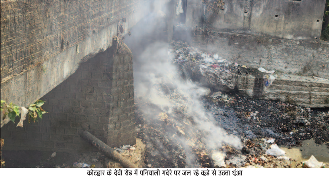
कोटद्वार के देवी रोड में पनियाली गदरे पर जल रहे कूड़े से उठता धुंआ

घाड़ से होते हुए शहर के बीच से गुजरने वाले पनियाली गदरे को कई लोगों ने कूड़ा डंपिंग जॉन बना दिया है। नतीजा, आमजन की यह लापरवाही गर्मी के मौसम में भारी पड़ रही है। हालत यह है कि नजीबाबाद चौराहे से करीब पांच सौ मीटर दूर देवी रोड पर पड़ने वाली पुलिया के नीचे दो दिन से कूड़े का ढेर धधक रहा है। शुक्रवार सुबह आग की लपेट इतनी भयंकर थी कि वह गदरे से पुल तक पहुंच रहे थे। देखते ही देखते चारों ओर भयंकर जहरीला धुंआ फैलने