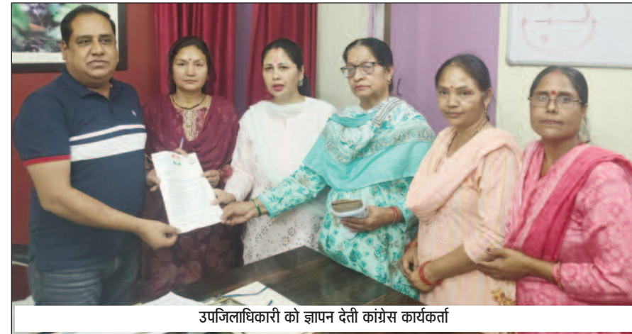
उपजिलाधिकारी को ज्ञापन देती कांग्रेस कार्यकर्ता

कोटद्वार : कर्नाटक में महिलाओं के साथ हुए यौन शोषण की घटना पर जिला महिला कांग्रेस कमेटी ने आक्रोश व्यक्त किया है। कहा कि आरोपी नेता प्रज्वल रेवन्ना के खिलाफ