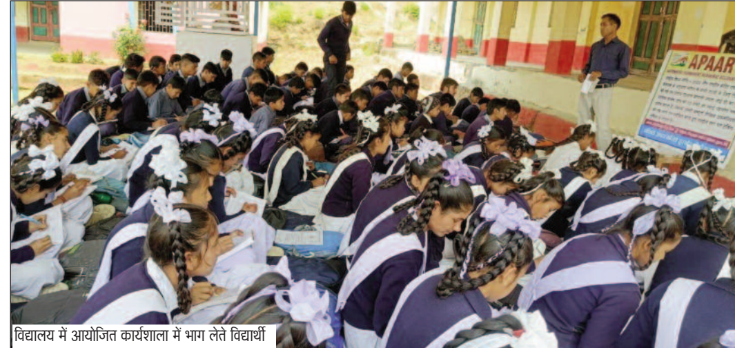
विद्यालय में आयोजित कार्यशाला में भाग लेते विद्यार्थी