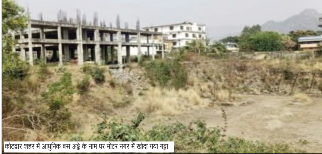
कोटद्वार शहर में आधुनिक बस अड्डे के नाम पर मोटर नगर में खोदा गया गड्डा