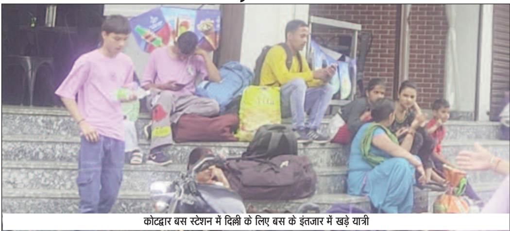
कोटद्वार बस स्टेशन में दिल्ली के लिए बस को इंतजार में खड़े यात्री