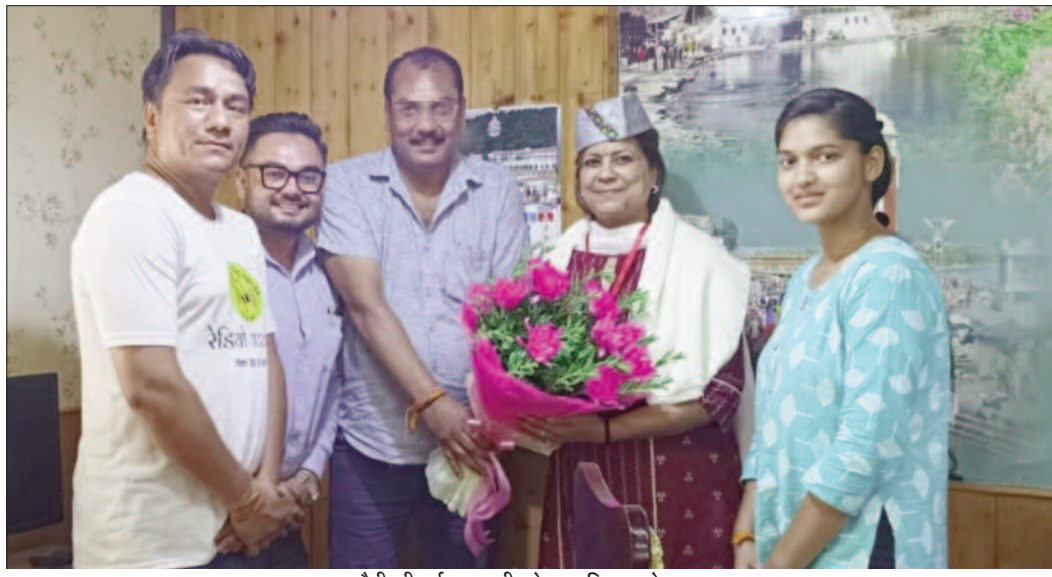
पौड़ी की पूर्व एसएसपी को सम्मानित करते सदस्य

उन्होंने संबंधित ड्रग इंस्पेक्टर को 07 दिन के लिए युद्धस्तर पर जनपद में निरीक्षण करने को कहा। साथ ही निर्देश दिए कि सभी मेडिकल स्टोरों में सीसीटीवी कैमरा लगे हैं या नहीं, मेडिकल स्टोर संचालक के पास लाइसेंस, संचालक स्वयं तेनात रहता है कि नहीं तथा मेडिकल स्टोर बच्चों को कोई नशीली सामग्री तो नहीं विक्रय करता अथवा कोई अवैध तरीके की नशीली दवाएं तो नहीं बेच रहे हैं इसका बारीकी से निरीक्षण करें। उन्होंने संबंधित विभागों को सभी इंजीनियरिंग कॉलेज, मेडिकल कॉलेज, अन्य शैक्षणिक संस्थानों में नियमित रूप से स्वास्थ्य के प्रति लोगों को जागरूक करने के लिए वर्कशॉप अथवा जन जागरूकता कार्यक्रम आयोजित करने को कहा।