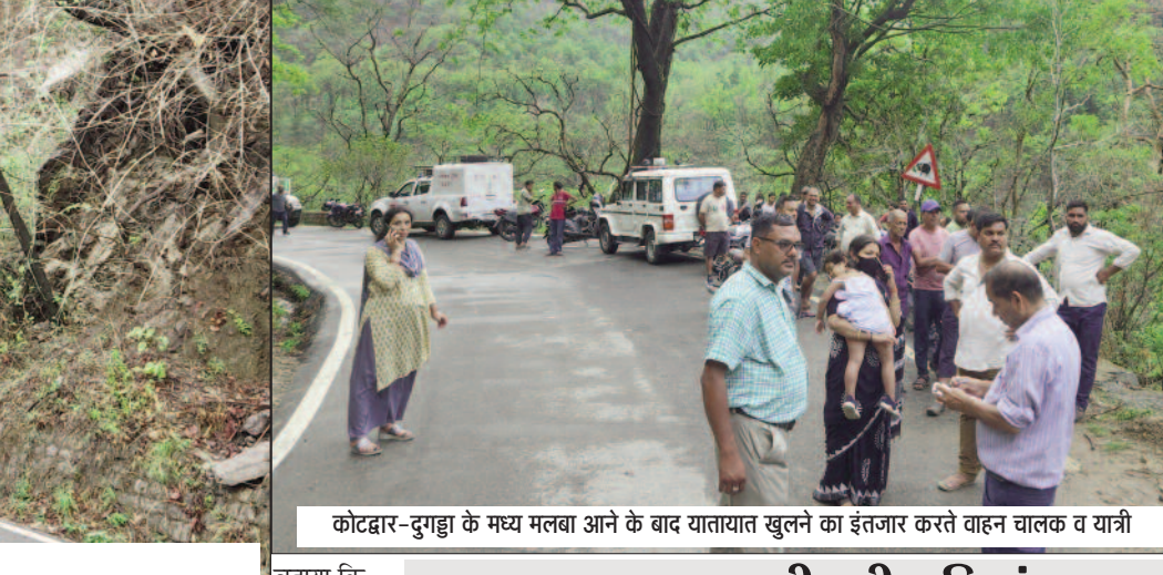
कोटद्वार-दुगढ़ा के मध्य मलबा आने के बाद यातायात खुलने का इंतजार करते वाहन चालक व यात्री