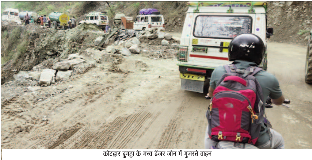
कोटद्वार दुगढ़ा के मध्य डेंजर जॉन में गुजरते वाहन

मरम्मत करवाता। लेकिन, एक वर्ष बीत जाने के बाद भी जिम्मेदारी सिस्टम ने इसकी सुध नहीं ली। नतीजा गत वर्षकाल के जखम इस वर्ष भी भारी पड़ रहे हैं। शनिवार को हुई बारिश के दौरान