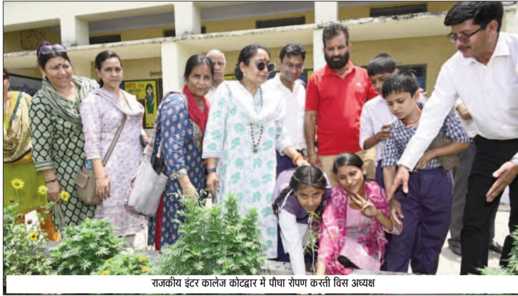
राजकीय इंटर कॉलेज कोटद्वार में पौधा रोपण करती विस अध्यक्ष