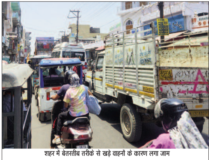
शहर में बेतरतीब तरीके से खड़े वाहनों के कारण लग रहा जाम

कोटद्वार : शहर में पार्किंग व्यवस्था नहीं होने से आए दिन सड़क पर जाम की स्थिति बन रही है। भीषण गर्मी के बीच शहरवासियों को घंटों जाम खुलने का इंतजार करना पड़ रहा है। हालात यह है कि अधुनिक बस अड्डा व पार्किंग के नाम पर मोटर नगर में आज भी केवल एक गड्डा ही नजर आ रहा है। इससे पता चलता है कि जनप्रतिनिधि व अधिकारी जन समस्या को लेकर कितने लापरवाह हैं।