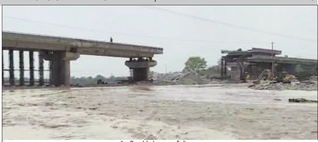
पहाड़ में बारिश होने से मालन नदी में बढ़ा जलस्तर

13 जुलाई को कोटद्वार से भाबर को जोड़ने वाला मालन नदी पर बना पुल धराशाही हो गया था। पुल टूटने के बाद भाबर क्षेत्र में रहने वाली करीब पंचास