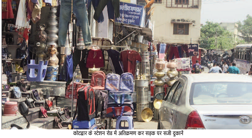
कोटद्वार के स्टेशन रोड में अतिक्रमण कर सड़क पर सजी दुकानें

गढ़वाल के प्रवेश द्वार कोटद्वार में अतिक्रमण नासूर बनता जा रहा है। अधिकांश व्यापारियों ने आधी सड़क