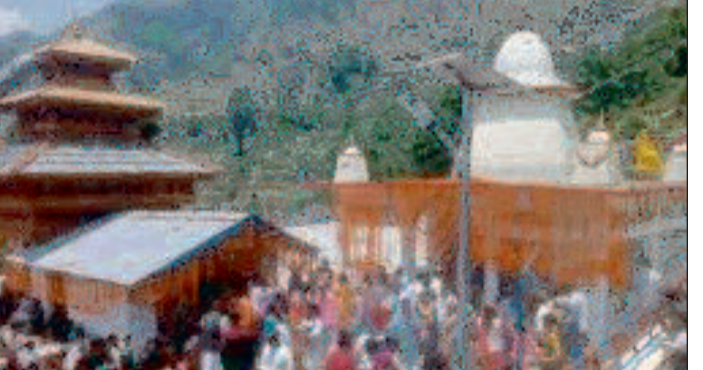
दर्शन करने पहुंचे। माता के भक्तों ने समृद्धि की मन्त्रे मांगीं। इस मौके पर कतारों में लग कर मत्था टेक सुख इंदौली गांव की बेटियां (ध्यांटुडियां)

विकासनगर। जेट माह के तीसरे रविवार को इंदौली और जाड़ी स्थित जौनसार बावर की इष्ट देवी मां काली के मंदिरों में दर्शन के लिए भक्तों की भीड़ उमड़ पड़ी। चकराता क्षेत्र के इंदौली और जाड़ी गांव में मां काली के पौराणिक मंदिर हैं। जेट माह में आने वाले हर रविवार को मंदिर में मां काली की पूजा करना अत्यंत शुभ माना गया है। इन मंदिरों के प्रति लोगों की आभार अस्थ्या जुड़ी हुई है। मंदिर में दर्शन करने के लिए शनिवार रात से ही भक्तों ने इंदौली गांव में आना शुरू कर दिया था। सुबह तक हजारों की संख्या में लोग मंदिर में