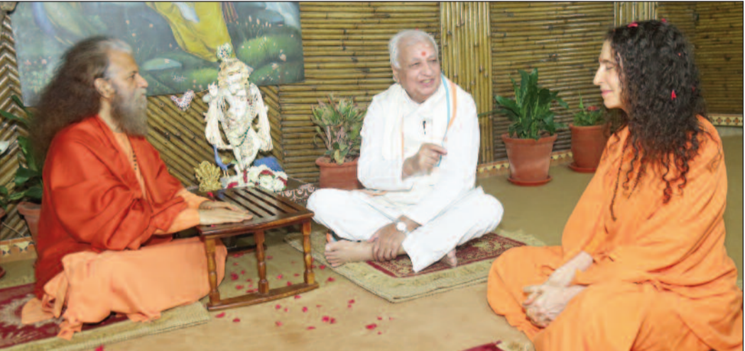
होती। हमारे शास्त्र भी हमें यही शिक्षा देते हैं कि परिस्थितियों का सामना कैसे करना है, कोई भी स्थिति सदैव एक जैसी नहीं रहती, इसलिए उस से कैसे उबरना है।

धाम में निर्माण कार्यों के लिए 11 वाहन हैं। केदारनाथ में निर्माण कार्यों के लिए विभिन्न एजेंसियों के पास करीब 11 वाहन हैं। इनमें चार पोकलैंड, दो डंपर, दो क्रो कटर, एक ट्रैक्टर और दो जेसीबी शामिल हैं। सोशल मीडिया पर भी शुरू हुआ विरोध, तीखी टिप्पणी कर रहे लोग पर्यावरण के लिहाज बेहद संवेदनशील केदारनाथ मंदिर क्षेत्र में डील चलित एसयूवी का विरोध बढ़ रहा है। सोशल मीडिया पर एसयूवी के मुद्दे पर यूजर बॉकेटीसी और सरकार के इस फैसले पर तीखे सवाल उठा रहे हैं। जहां एसयूवी के विरोध में लोगों की संख्या बढ़ रही है, वहीं समर्थन में कोई नजर नहीं आ रहा।