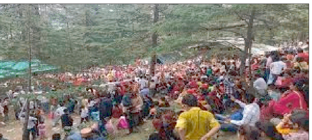
पर अपने बच्चों के बाल भी कटवाए। जरम मनाने के लिए बावर, शिलगंज, देवघार, फनार, बंगण समेत आसपास के क्षेत्र के लोग गाजे-बाजे के साथ मेला स्थल बच्चों और परिवार के साथ देव दर्शन के लिए कैमाड़ा जंगल पहुंचे। शनिवार को हुई बारिश से लोगों को गर्मी से कुछ हद तक

विकासनगर। बाशिक महासू महाराज के रविवार को कैमाड़ा जंगल पहुंचने के साथ ही दो दिवसीय जखोली मेले की शुरुआत हो गई। देवता के पहुंचते ही सैकड़ों लोग देव दर्शन को कैमाड़ा में उठे रहे। लोगों ने ढोल-दमो की थाप पर हारलु नृत्य कर बाशिक महासू महाराज की आराधना की। देर शाम तक लोक गीतों के साथ परंपरागत तांदी-नृत्य की धूम रही। लोगों ने देवता के दर्शन कर परिवार की खुशहाली की मनौती मांगी। जखोली मेले के लिए रविवार सुबह बस्तील गांव से गाजे-बाजे के साथ चली देव पालकी दोपहर बाद कैमाड़ा जंगल पहुंची। यहां जखोली मेला मनाने आए विभिन्न गांवों के सैकड़ों लोगों ने बाशिक महासू के जयकारे लगाए। देव पालकी के आगमन से परंपरागत जखोली मेले की शुरुआत हो गई। जखोली मेले के पहले दिन देव दर्शन को बड़ी संख्या में जुटे लोगों ने बाशिक महासू के दर्शन कर मंत्र मांगीं। इस दौरान कई लोगों ने देवता से मांगी गई मन्त्र पूरी होने