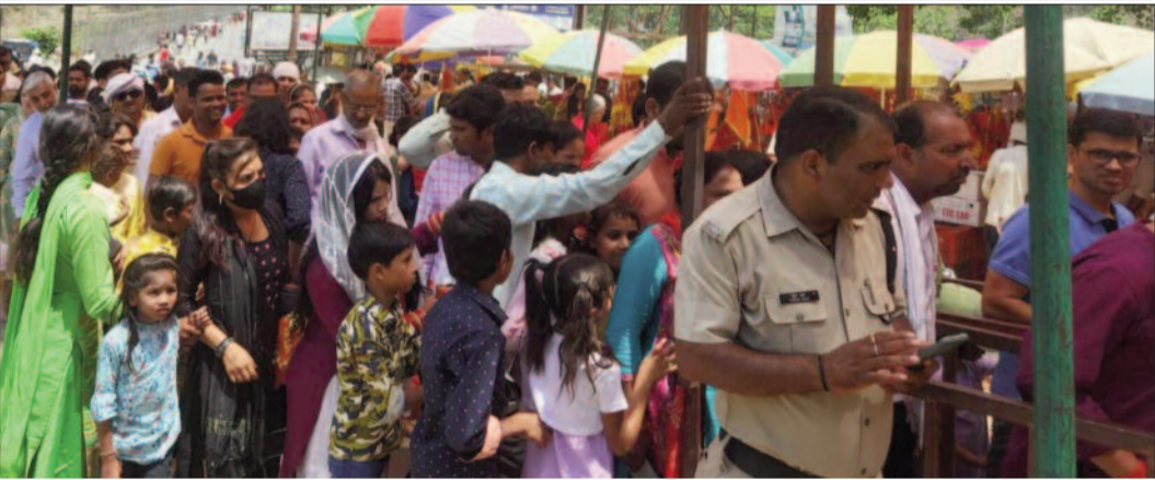
कोटद्वार की श्री सिद्धबली मंदिर में प्रवेश द्वार पर लगी भक्तों की लाइन

जयन्त प्रतिनिधि। कोटद्वार: रविवार को भीषण गर्मी व चिलचिलाती धूप के बाद भी श्री सिद्धबली बाबा दर्शन को सैकड़ों भक्तों की भीड़ उमड़ी हुई थी। हालत यह थी कि बाजार से सिद्धबली को जाने वाले मार्ग पर पूरे दिन जाम की स्थिति देखने को मिली। भक्तों ने घंटों लाइन में खड़े रहकर बाबा के दर्शन किए। इस दौरान भक्तों के लिए मंदिर में विशेष भंडारे का भी आयोजन किया गया था। गढवाल के प्रवेश द्वार कोटद्वार में स्थित श्री सिद्धबली बाबा से सैकड़ों भक्तों की आस्था जुड़ी हुई है। यही कारण है कि मंदिर में रविवार व मंगलवार को भक्तों का तांता लगा रहता है। रविवार को सुबह से भक्त बाबा के दर्शन को पहुंच रहे थे। अधिकांश श्रद्धालु अपने परिवार के साथ अपनी कार से पहुंच रहे थे। जिसके कारण बुद्धा पार्क से