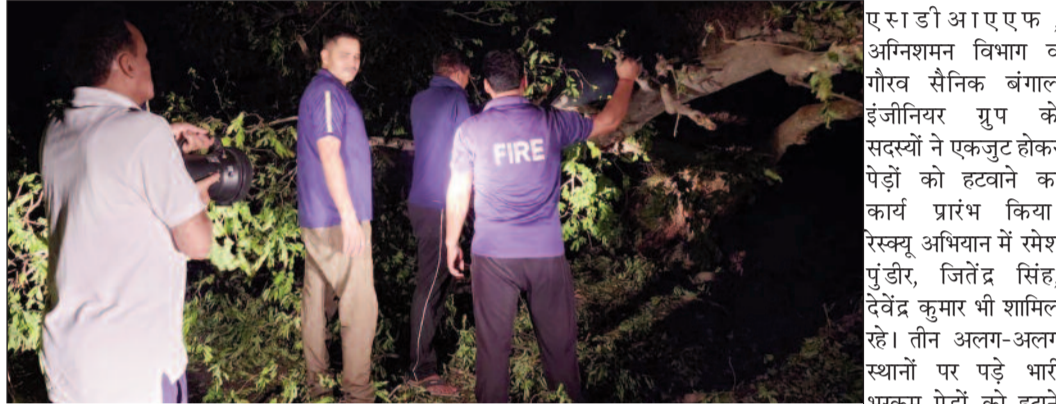
कोटद्वार के पुलिंडा मार्ग में पेड़ों को हटवाने में जुटे एसडीआरएफ, अग्निशमन व संगठन के सदस्य

बैठक में मालिनी किसान पंचायत की ओर से नहरों की सफाई की शिकायत उठाने के बाद भी समस्या का निराकरण नहीं होने पर रोष व्यक्त किया गया। कहा कि नगर निगम व सिंचाई विभाग कासकरों के हितों को लेकर विभाग ने नदी से वैकल्पिक मार्ग तैयार किया। लेकिन, यह एक बेहतर विकल्प नहीं है। वर्षाकाल में जनता को और अधिक समस्याएं झेलनी पड़ेंगी। लगातार शिकायत के बाद भी