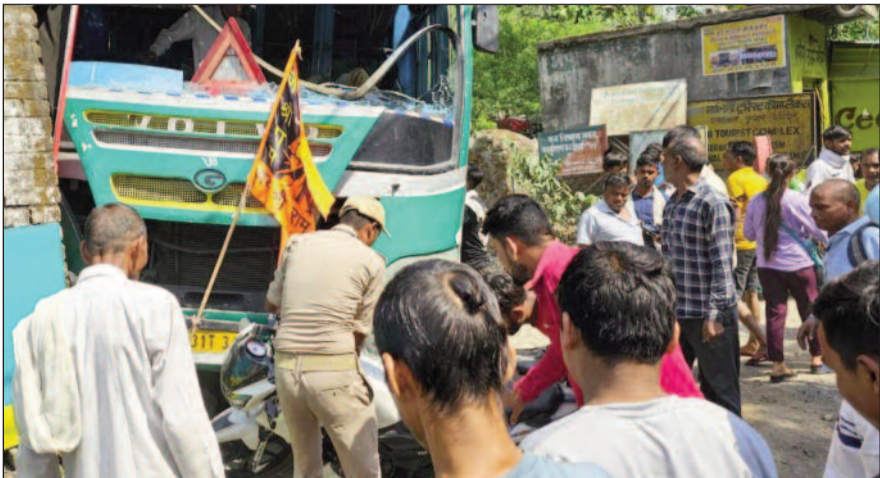
दुकान की दीवार पर टक्कर मारने के बाद मौके पर खड़ी बस