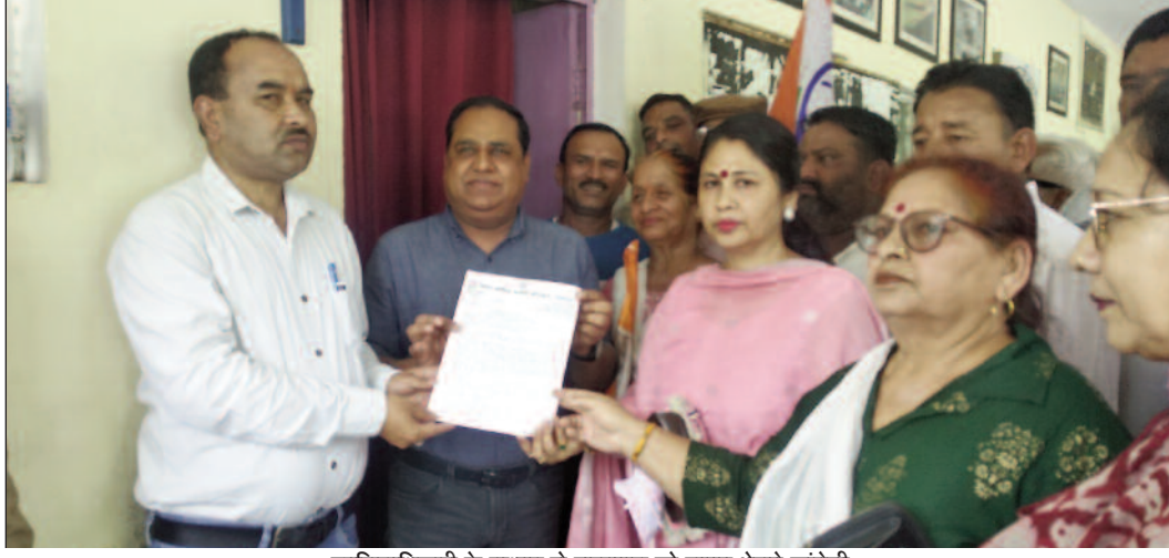
उपजिलाधिकारी के माध्यम से राज्यपाल को ज्ञापन भेजते कांग्रेसी