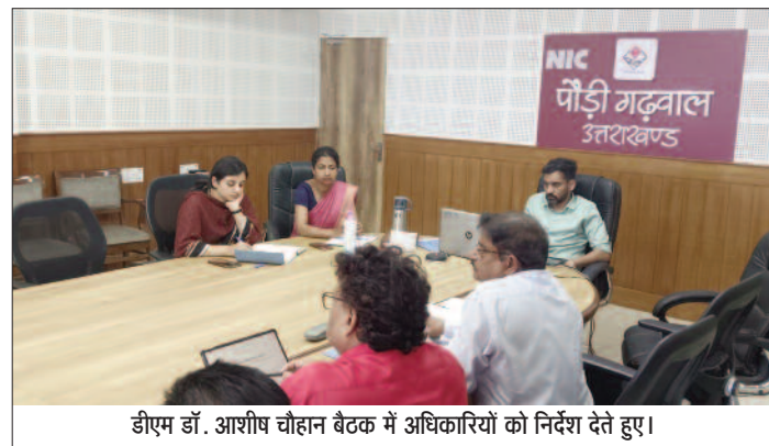
डीएम डॉ. आशीष चौहान बैठक में अधिकारियों को निर्देश देते हुए।

जयन्त प्रतिनिधि। पौड़ी : जिलाधिकारी डॉ. आशीष चौहान ने एनआईसी कक्ष में डेगू की रोकथाम से संबंधित बैठक ली। उन्होंने समस्त नगर निकाय व स्वास्थ्य विभाग के अधिकारियों को गंभीरता से कार्य करने के निर्देश दिये। कहा कि बताये जाने के बावजूद भी बार-बार लापरवाही करता है तो उसका अधिनियम के अंतर्गत चालान करना सुनिश्चित करें। जिलाधिकारी ने कहा कि सभी नगर निकाय अपने-अपने क्षेत्रों में नियमित रूप से साफ-सफाई, कूड़े का जल्दी निस्तारण और पानी की निकासी दुरुस्त करें मंगलवार को आयोजित बैठक में जिलाधिकारी ने नगर