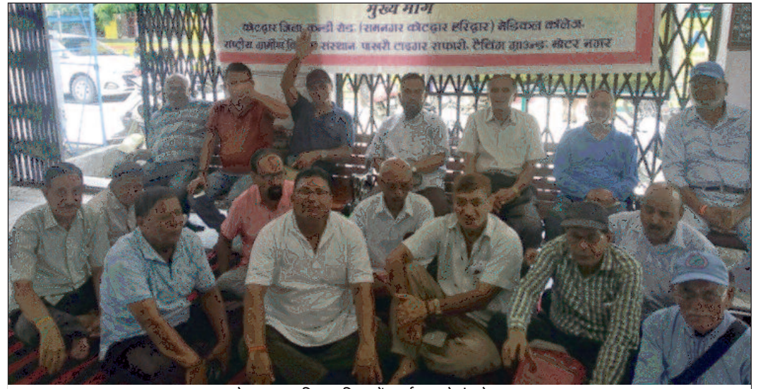
कोटद्वार नगर निगम परिसर में प्रदर्शन करते मंच के सदस्य