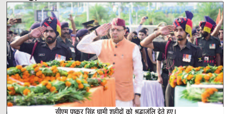
सीएम पुष्कर सिंह धामी शहीदों को श्रद्धांजलि देते हुए।

देहरादून : जम्मू के कटुआ में शहीद हुए उत्तराखंड के पांच जवानों के पार्थिव शरीर मंगलवार को जौलीग्रंट एयरपोर्ट पहुंचे। इस दौरान मुख्यमंत्री पुष्कर सिंह धामी ने पांचों शहीद जवानों के पार्थिव शरीर पर पुष्प चक्र अर्पित कर संपूर्ण राज्य की ओर से उन्हें श्रद्धांजलि अर्पित की। अपने वीर सपूतों के बलिदान को याद कर मुख्यमंत्री भावुक नजर आए मुख्यमंत्री ने कहा कि वह हम सभी प्रदेशवासियों के लिए अलंघ्य पीढ़ा का क्षण है क्योंकि हमने भाई और बेटा भी खोया है। हमारे रणवीरों ने उत्तराखंड की समृद्ध, सैन्य परंपरा का पालन करते हुए मां भारती के चरणों में अपना सर्वस्व न्योड़कर कर