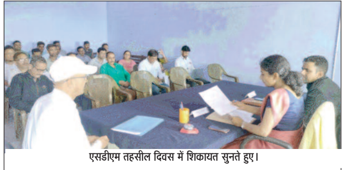
एसडीएम तहसील दिवस में शिकायत सुनते हुए।

जयन्त प्रतिनिधि। पौड़ी : जन समस्याओं के निस्तारण हेतु तहसील मुख्यालय पौड़ी में तहसील दिवस आयोजित किया गया। तहसील दिवस में 09 शिकायतें दर्ज हुईं, जिसमें से 02 शिकायतों का मौके पर ही निस्तारण किया गया व अन्य शिकायतें संबंधित विभागों को प्रेषित की गई है। एसडीएम ने