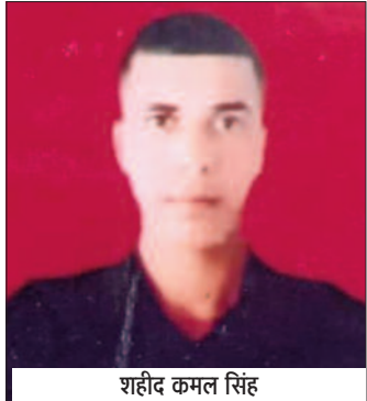
शहीद कमल सिंह