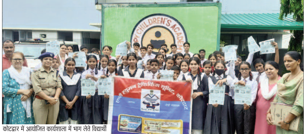
कोटद्वार में आयोजित कार्यशाला में भाग लेते विद्यार्थी