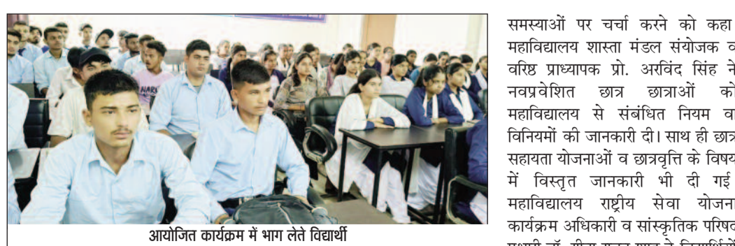
आयोजित कार्यक्रम में भाग लेते विद्यार्थी

कोटद्वार : राजकीय महाविद्यालय कण्वाघाटी में आयोजित कार्यक्रम में नव प्रवेशित विद्यार्थियों का स्वागत किया गया।