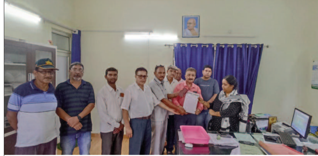
ऊर्जा निगम में अधिशासी अभियंता को ज्ञापन देते कांग्रेसी