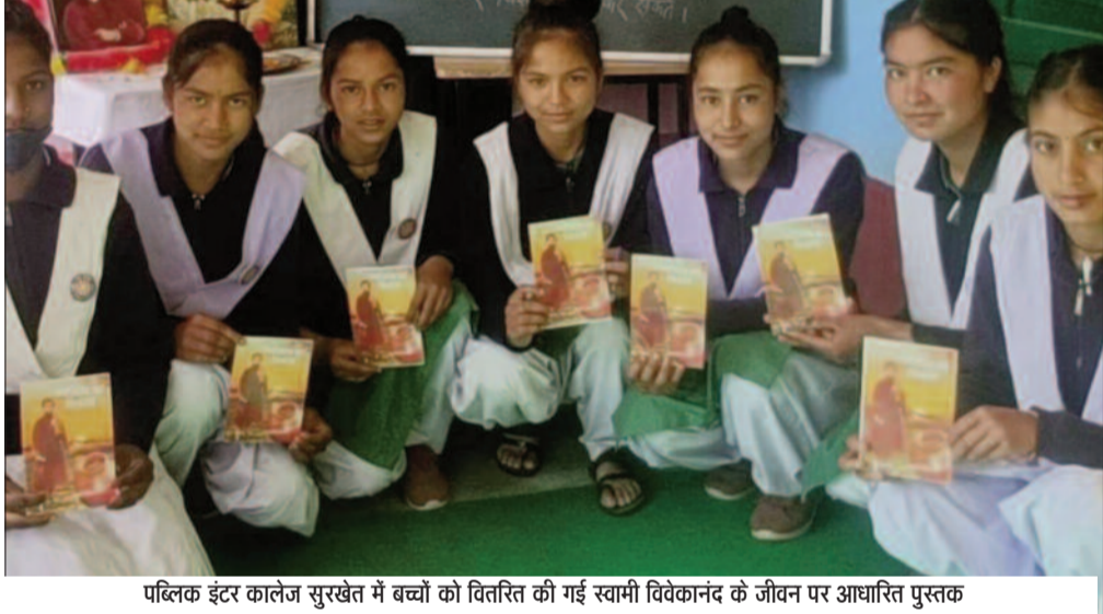
पब्लिक इंटर कॉलेज सुरखेत में बच्चों को वितरित की गई स्वामी विवेकानंद के जीवन पर आधारित पुस्तक

जयन्त प्रतिनिधि। कोटद्वार : स्वामी विवेकानंद की पुण्य तिथि पर पब्लिक इंटर कॉलेज सुरखेत में कार्यक्रम का आयोजन