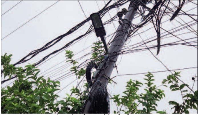
कोटद्वार में बदरीनाथ मार्ग में लगी स्ट्रीट लाइट

नई टिहरी : मानसून सीजन को देखते हुए जनपद में डीएम मयूर दीक्षित के निर्देश पर शुक्रवार को समस्त तहसीलों में कंट्रोल रूम स्थापित किये गये हैं। डीएम ने सभी संबंधित अधिकारियों को कंट्रोल रूम के नंबर आम जनमानस के बीच प्रसारित करने को कहा है, ताकि आपदा के समय सूचनाओं का त्वरित आदान-प्रदान हो सके। शुक्रवार को डीएम दीक्षित ने बरसात में सम्भावित आपदाओं के दृष्टिकोण सड़क मार्ग, झील तल स्तर, सिंचाई नहर, पेयजल, विद्युत आदि व्यवस्थाओं पर लगातार नजर बनाने रखने की बात कही। उन्होंने अधिकारियों को किसी भी आपदा व दुर्घटना की स्थिति में जिला स्तर के अधिकारियों को हस्तक्षेप धूप में तत्काल सूचनाओं का आदान-प्रदान करने के निर्देश दिये हैं, ताकि सभी विभाग समय-समय बनाकर तत्काल समस्याओं का समाधान कर सकें। किसी भी आपदा व दुर्घटना की स्थिति में किसी के भी द्वारा जनपद आपदाकालीन परिवहन केंद्र व आपदा नियंत्रण कक्ष के फोन नंबर-01376-234793, 233433 टोल फ्री नंबर 01376-1077, मोबाइल नंबर 9126268098, 7465809009, 9456533332, 7983340807 पर सूचना दे सकते हैं। इसके साथ ही तहसील स्तर पर स्थापित कंट्रोल रूम के नम्बरों में मददनेगी व प्रतापनगर दूरभाष नंबर 9258654564, बागमगा और घनसाली 8267013524, जगा 8126194742, देवप्रयाग 01378-266004, कीर्तिनगर 01370-260045, नरेन्द्रनगर 8171431255, धनौली 8273051016, नैनाग 9119748516, जाखणीधार 9627961057, टिहरी 8445308195, पावकीदेवी 8077023387, कडौसीड 7037886114 पर सम्पर्क कर आम जनमानस आपदा व दुर्घटनाओं की जानकारी दे सकत हैं। (एजेंसी)