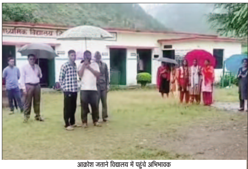
आक्रोश जताने विद्यालय में पहुंचे अभिभावक

जयन्त प्रतिनिधि। कोटद्वार : वीरगंजाल के अंतर्गत राजकीय उच्चतर माध्यमिक विद्यालय जिवाई में अंग्रेजी विषय की शिक्षिका पिछले तीन साल से अनुपस्थित चल रही है। आक्रोशित प्रामाणों ने