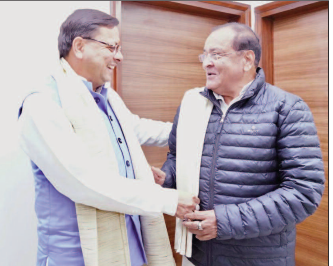
देहरादून। मुख्यमंत्री पुष्कर सिंह धामी ने बुधवार को विधानसभा गैरसैन (भराड़ीसैन) में नेता प्रतिपक्ष यशपाल आर्य से शिष्टाचार भेंट करते हुए।