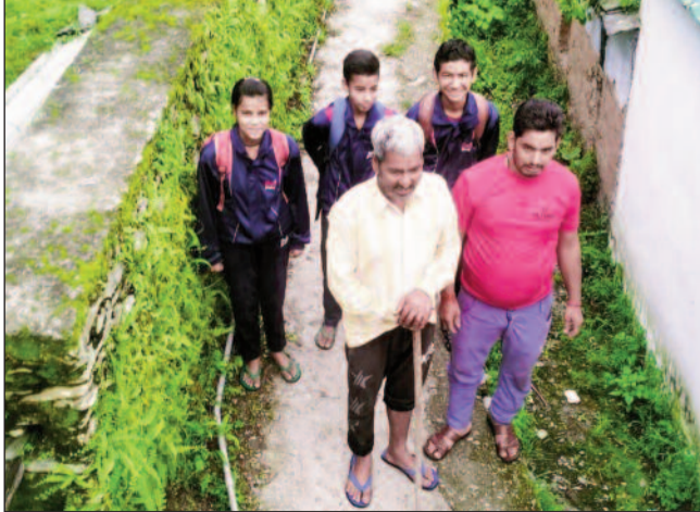
के लिए ही उपयोग किया जाता है। गांव में ही दो मील दूरी पर जंगल पार हाईस्कूल है। जहां गांव के मात्र तीन छात्र ही पढ़ते हैं। जंगली जानवरों के भय से

जयन्त प्रतिनिधि। पौड़ी : आसान नहीं गांव का जीवन यापन, लगातार पलायन के कारण सामान्य परिवारों पर पड़ा असर। डोंगी गांव एक दशक पूर्व पूरी तरह अबाद था। गांव के हर चौक में किलकारी गुंजती थी। गांव में आंगनबाड़ी केंद्र था जहां बच्चों की किलकारी सुनने मिलती थी। लेकिन बीते एक दशक में गांव में गिने चुने परिवार ही रह गए हैं। गांव में कभी खेती बाड़ी प्रयाप्त मात्रा में होती थी। लोगों की मुख्य आजीविका कृषि थी। गांव की अच्छी खासी जनसंख्या थी। शिक्षा के लिए गांव में ही प्राथमिक एवं उच्च प्राथमिक विद्यालय था। प्राथमिक विद्यालय छात्र संख्या शून्य होने से बंद हो है। भवन अब केवल मतदान