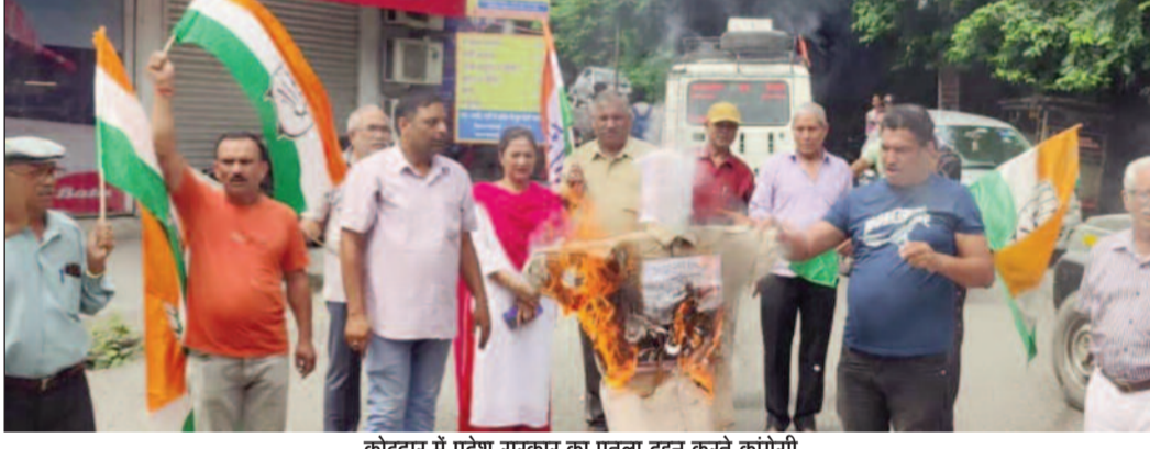
कोटद्वार में प्रदेश सरकार का पुतला दहन करते कांग्रेसी