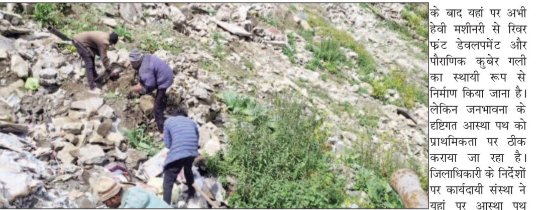
पथ ठीक करने का काम शुरू कर दिया

पथ ठीक करने का काम शुरू कर दिया है। हालांकि नदी का जल स्तर कम होने ठीक करने का काम शुरू कर दिया है।