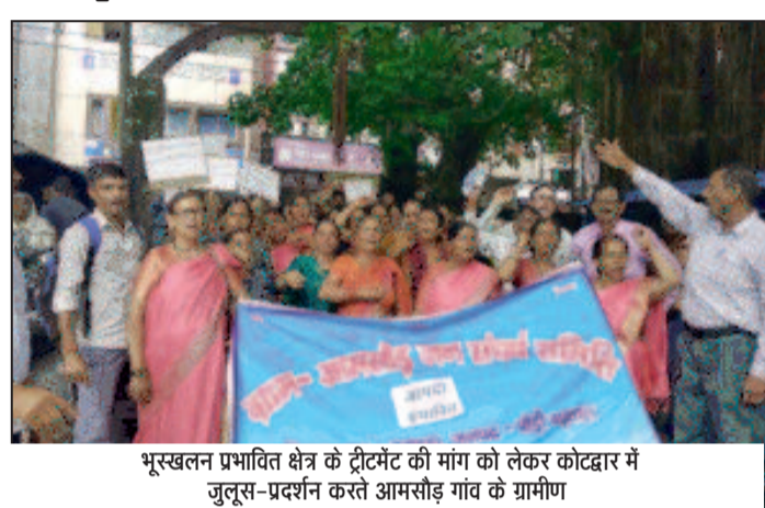
भूखलन प्रभावित क्षेत्र के ट्रैटमेंट की मांग को लेकर कोटद्वार में जुलूस-प्रदर्शन करते आमसौड़ गांव के ग्रामीण

से मुख्यमंत्री को ज्ञापन भेजा। इस दौरान वक्ताओं ने कहा कि आमसौड़ कच्चा पिछले साल से आपदा की मार झेल रहा है। पिछले वर्ष भी 23 अगस्त को भारी बाढ़ से कारण गांव के ऊपर स्थित पहाड़ी से भूस्खलन हुआ था और उस समय भी ग्रामीणों को बहुत नुकसान उठाना पड़ा था। इस वर्ष भी 6 जुलाई