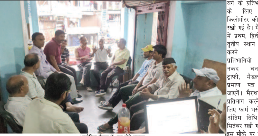
आयोजित बैठक में भाग लेते सदस्य

जयन्त प्रतिनिधि। पौड़ी : व्यापार मंडल सतपुली व होली के हल्वार टीम ने दो अक्टूबर को सद्भावना मैराथन के आयोजन का निर्णय लिया है। इसके लिए सदस्यों की विशेष टीम भी गठित की जाएगी। आयोजित बैठक में सदस्यों ने कहा कि हाफ मैराथन तीन वर्गों में आयोजित की जाएगी, जिसमें पुरुष वर्ग के लिए 20 किलोमीटर, महिलाओं व अंडर-14