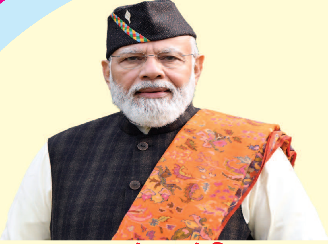
नरेन्द्र मोदी प्रधानमंत्री

21वीं सदी के विकसित भारत के निर्माण के दो प्रमुख स्तंभ हैं। पहला, अपनी विरासत पर गर्व और दूसरा, विकास के लिए हर संभव प्रयास। आज उत्तराखण्ड, इन दोनों ही स्तंभों को मजबूत कर रहा है। ये दशक उत्तराखण्ड का दशक होगा। जय हिन्द जय उत्तराखण्ड।