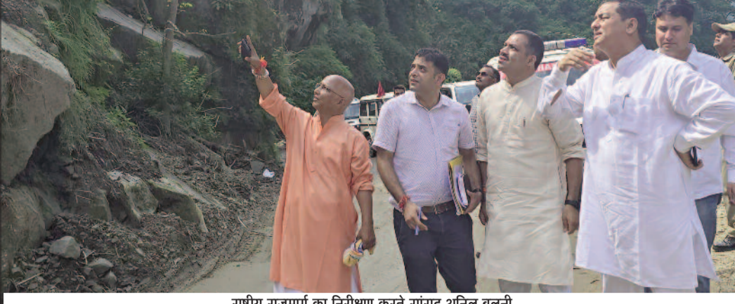
राष्ट्रीय राजमार्ग का निरीक्षण करते सांसद अनिल बलूनी

कोटद्वार : कोटद्वार से होते हुए रुद्रप्रयाग जा रहे सांसद अनिल बलूनी ने कोटद्वार-दुगड्डा के मध्य अपना वाहन रुकवाकर राष्ट्रीय राजमार्ग का निरीक्षण किया। उन्होंने अधिकारियों को बेहतर गुणवत्ता के साथ राष्ट्रीय राजमार्ग की मरम्मत करवाने के निर्देश दिए। कहा कि आमजन व वाहन चालकों को आवागमन में किसी प्रकार की पेशानी न हो इसका विशेष ध्यान रखें।