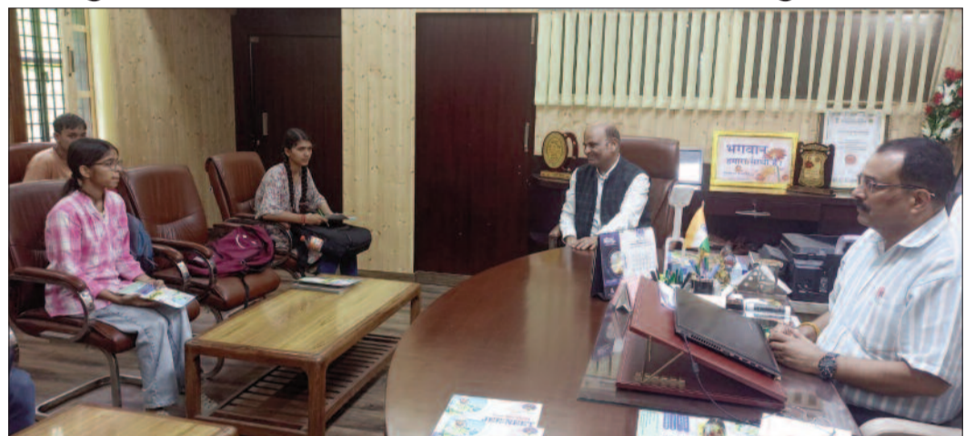
बेहतर मौका देने के लिए प्रयास कर रहा जाएगा। विद्यार्थियों को चयन हेतु आवेदन करना होगा। आवेदन करने वाले विद्यार्थियों की परीक्षा होगी और चयनित विद्यार्थियों को निःशुल्क प्रदान की