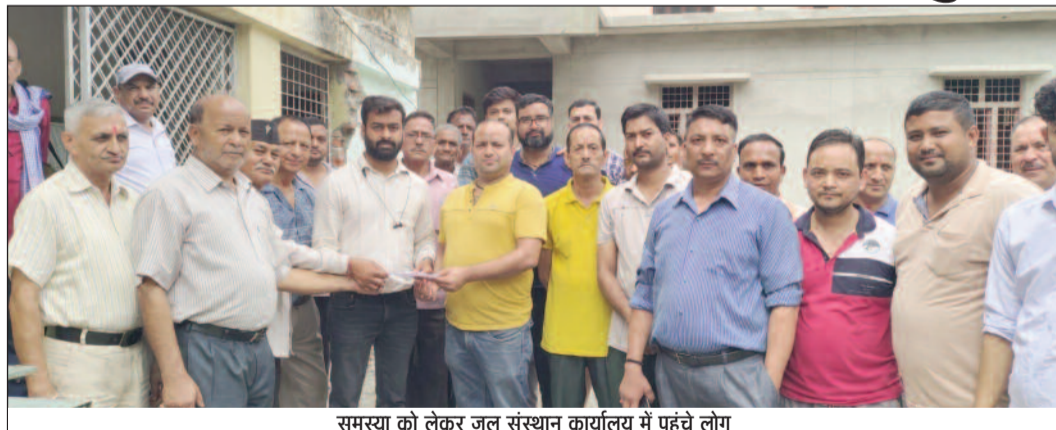
समस्या को लेकर जल संस्थान कार्यालय में पहुंचे लोग