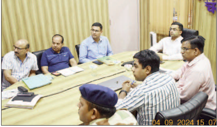
योजना तैयार की गई है। जिलाधिकारी ने एसडीएम को निर्देशित किया कि नीति और योजना में बाईट टूरिज्म के तहत प्रस्तावित परियोजनाओं के क्रियान्वयन से पहले आर्मी, आईटीवीपी, हितधारकों और स्थानीय लोगों को प्रस्तावित कार्यों की पूरी जानकारी दी जाए। ताकि बेहतर तालमेल के साथ काम पूरे किए जा सकें। उन्होंने निर्देश दिए कि आईएनआई के साथ मिलकर प्रस्तावित विकास कार्यों के लिए

जयन्त प्रतिनिधि। चमोली : सीमांत गांव माणा और नीति में धार्मिक और पर्यटक स्थलों के विकास हेतु मास्टर प्लान के तहत कार्य किए जायेंगे। इसके लिए आईएनआई डिजाइन कंपनी ने मास्टर प्लान तैयार कर लिया है।