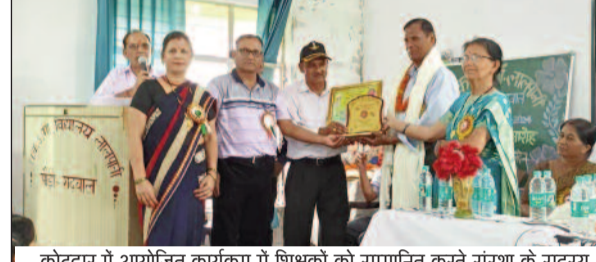
कोटद्वार में आयोजित कार्यक्रम में शिक्षकों को सम्मानित करते संस्था के सदस्य