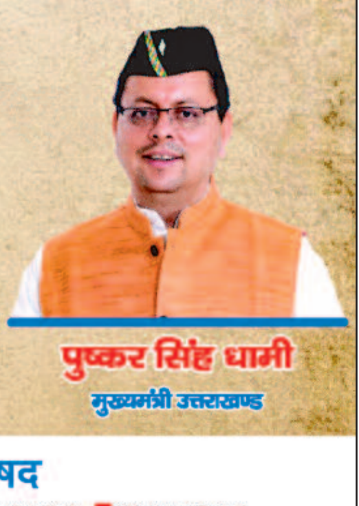
पुष्कर सिंह धामी मुख्यमंत्री उत्तराखण्ड