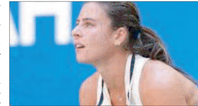
अपने घरेलू दर्शकों के सामने खेलते हुए, नवरो ने दूसरे सेट में आश्चर्यजनक वापसी करते हुए 6-2, 7-5 से जीत दर्ज की और यूएस ओपन के अंतिम चरण में प्रवेश किया। यह परिणाम अगले सप्ताह उसकी पहली शीर्ष 10 रैंकिंग की गारंटी देगा। 23 वर्षीय अमेरिकी ने अपना

न्यूयॉर्क, 13वीं वरीयता प्राप्त एम्मा नवरो ने दूसरे सेट में 1-5 से पिछड़ने के बाद शानदार वापसी करते हुए यूएस ओपन महिला एकल चर्टर फाइनल में स्पेन की पाउला बडोसा को हराकर अपने पहले ग्रैंड स्लैम सेमीफाइनल में जगह बनाई।