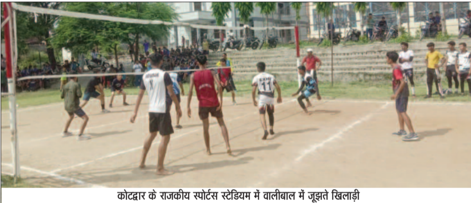
कोटद्वार के राजकीय स्पोर्ट्स स्टेडियम में वालीबाल में जूझते खिलाड़ी