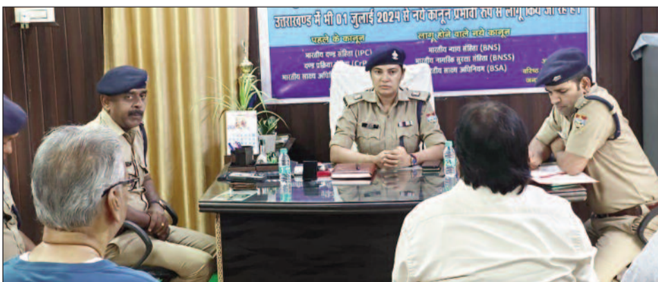
कोतवाली में बैठक लेते अपर पुलिस अधीक्षक

पुलिस ने ली सर्राफा कारोबारियों व अन्य व्यापारियों की बैठक