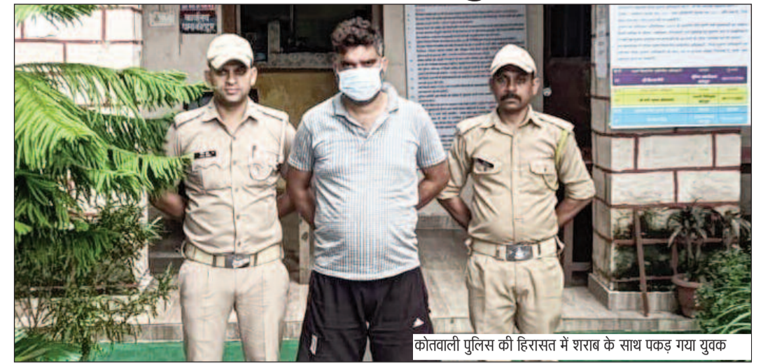
कोतवाली पुलिस की हिरासत में शराब के साथ पकड़ गया युवक

जयन्त प्रतिनिधि। कोटद्वार : कोतवाली पुलिस ने छः पेट्टी अवैध अंग्रेजी शराब के साथ एक युवक को गिरफ्तार किया है। आरोपी के खिलाफ आबकारी अधिनियम के तहत मुकदमा दर्ज कर लिया गया है।