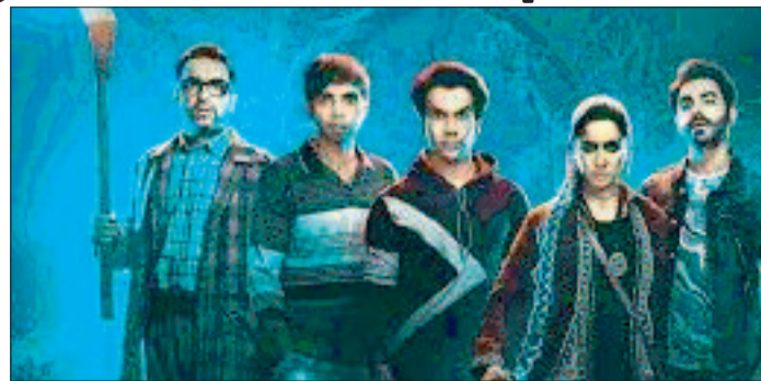
कामयाबी हासिल की है। अमेरिका में फिल्म का प्रदर्शन विशेष रूप से प्रभावशाली रहा है, जहां देश में नानी के मजबूत प्रशंसक आधार की बदौलत 2 मिलियन

नानी की नवीनतम फिल्म, सारिपोधा सानिवारम ने बॉक्स ऑफिस पर धमाल मचा दिया है, इसने अपने प्रदर्शन के चार दिन पूरे कर लिए हैं और इसकी गति धीमी होने का कोई संकेत नहीं दिख रहा है। 29 अगस्त, 2024 को रिलीज हुई, एक्शन ड्रामा ने चौथे दिन 10+ करोड़ रुपये की प्रभावशाली कमाई की है, जिससे कुल वैश्विक कमाई 68.52 करोड़ रुपये हो गई है। आंध्र प्रदेश और तेलंगाना में भारी बारिश के बावजूद, जिसने विजयवाड़ा और गुंटूर जैसे प्रमुख शहरों में दर्शकों की संख्या को प्रभावित किया, फिल्म ने अभी भी बुनिया भर में केवल चार दिनों में 40 करोड़ रुपये के करीब की कमाई करने में