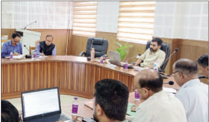
प्रबंधक सिडकुल को कारण बताओ नोटिस जारी किया। आयोजित बैठक में जिलाधिकारी ने लीड बैंक अधिकारी को ग्रोथ सेंटर सिडकुल में एटीएम को सुचारू करने के

जयन्त प्रतिनिधि। पौड़ी : जिला उद्योग मित्र की बैठक कलेक्ट्रेट सभागार में जिलाधिकारी डॉ. आशीष चौहान की अध्यक्षता में संपन्न हुई। उन्होंने औद्योगिक क्षेत्र सिडकुल में वेस्ट मैनेजमेंट की व्यवस्था को लेकर नगर आयुक्त कोटद्वार को निरीक्षण कर आवश्यक कार्यवाही के निर्देश दिए हैं। कहा कि आधारभूत सुविधाओं को बढ़ाने के लिए उद्योग विभाग, बैंकर्स, उद्योग एसोसिएशन व अन्य संबंधित अधिकारी समन्वय स्थापित करते हुए कार्य करें। औद्योगिक क्षेत्र सिडकुल में चहादिवारों का कार्य शुरू नहीं होने पर जिलाधिकारी ने क्षेत्रीय