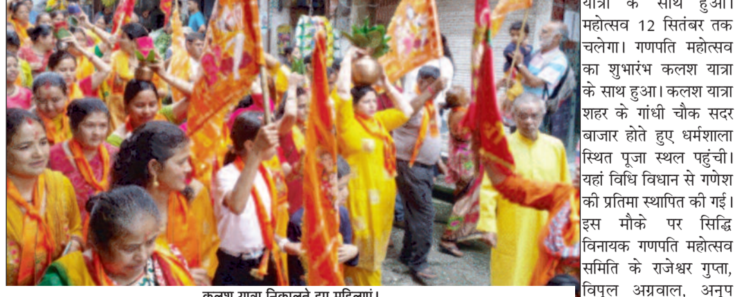
कलश यात्रा निकालते हुए महिलाएं।

जयन्त प्रतिनिधि। लैंसडौन : छवनी नगर लैंसडौन में