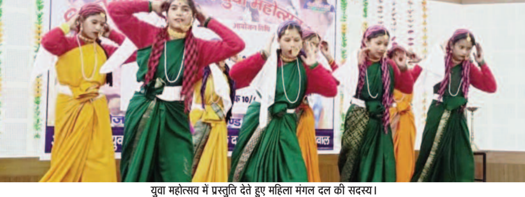
युवा महोत्सव में प्रस्तुति देते हुए महिला मंगल दल की सदस्य।

जयन्त प्रतिनिधि। थलीरैण : विकासखंड स्वयं बुवा महोत्सव 2024 का पावो में आयोजन किया गया। महोत्सव में 28 महिला मंगल दलों ने बड़चढ़ कर प्रतिभाग किया।