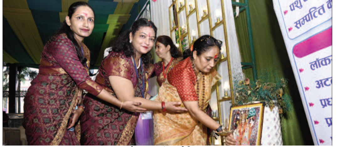
कार्यक्रम का शुभारंभ करती विस अध्यक्ष