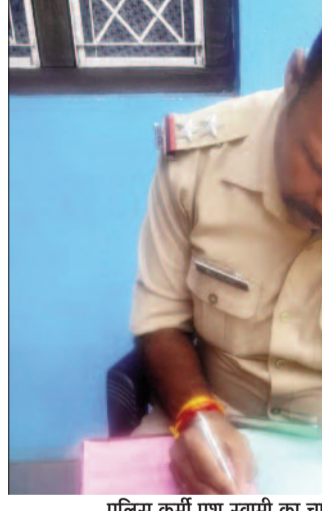
पुलिस कर्मि पशु स्वामी का चालान काटते हुए।

पौड़ी : जिला पुलिस ने बाजारों/सड़कों पर पशुओं को छोड़ने वाले पशु स्वामियों के खिलाफ अभियान शुरू कर दिया है। पुलिस ने बाजार/सड़कों पर पशुओं को छोड़ने वाले 9 पशु स्वामियों के विरुद्ध उत्तराखण्ड गोवंश संरक्षण अधिनियम-2015 के तहत कार्यवाही की गई है। बता दें कि पुलिस ने पूर्व में लोगों से पशुओं को बाजार/सड़कों न छोड़ने की अपील की थी। एसएसपी लोकेश्वर सिंह ने बताया कि जनपद में बाजारों/सड़कों पर आवारा घूमने वाले पशुओं के कारण अक्सर यातायात अवरुद्ध होने एवं इन पशुओं के कारण सड़क दुर्घटनाएं घटित होने होती रहती है। उन्होंने कहा कि आवारा घूमने वाले पशुओं पर नियंत्रण लगाये जाने हेतु