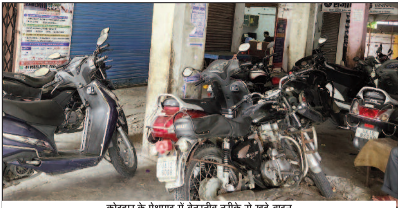
कोटद्वार के प्रेक्षागृह में बेतरतीब तरीके से खड़े वाहन

जयन्त प्रतिनिधि। कोटद्वार : शहर में पार्किंग के लिए बनाई गई निगम की योजना धरातल पर उतरने से पहले ही हवा हो गई। दरअसल, नगर निगम की ओर से सड़क किनारे चौड़े स्थानों को चिह्नित कर इन्हें पार्किंग स्थल के रूप में विकसित करने की योजना बनाई गई थी। लेकिन, एक वर्ष बीत जाने के बाद भी यह योजना धरातल पर रंग नहीं ला पाई। नतीजा सड़क किनारे बेतरतीब तरीके से पार्क वाहन यातायात में बाधा बन रहे हैं। शहर में लगातार वाहनों की संख्या