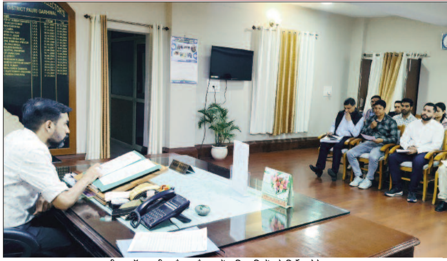
डीएम डॉ. आशीष चौहान बैठक में अधिकारियों को निर्देश देते हुए।

23 से 25 अक्टूबर 2024 तक चलेगा फिश एंगलिंग फेस्टिवल, तीन दिवसीय फिश एंगलिंग फेस्टिवल को लेकर रूपरेखा तैयार