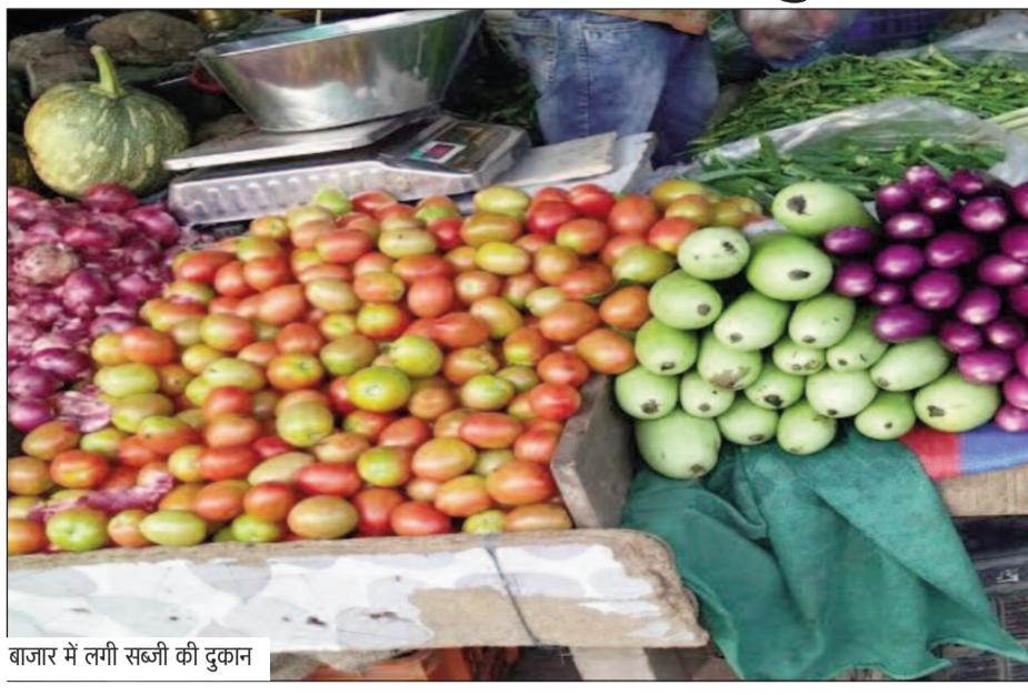
बाजार में लगी सब्जी की दुकान

दाम आसमान छूने लगे हैं। एक समय था जब सब्जी खरीदने पर सब्जी विक्रेता धनिया-मिर्च मुफ्त में देता था। लेकिन, आज यदि सब्जी के साथ मुफ्त का धनिया-मिर्च मांगा तो सब्जी विक्रेता आग-बबूला हो रहे हैं। दरअसल, धनिया-मिर्च की कीमतें इन दिनों आसमान छू रही हैं। सिर्फ धनिया-मिर्च ही नहीं, टमाटर भी इन दिनों सुर्ख लाल हो रहा है। बाजार में टमाटर सस्तर से अस्सी रूपए प्रति किलोग्राम के हिसाब से बिक रहा है। सप्ताह भर पहले तक यह टमाटर तीस-चालीस रूपए प्रति किलोग्राम बिक रहा था। थोक मंडी में ही व्यापारियों को