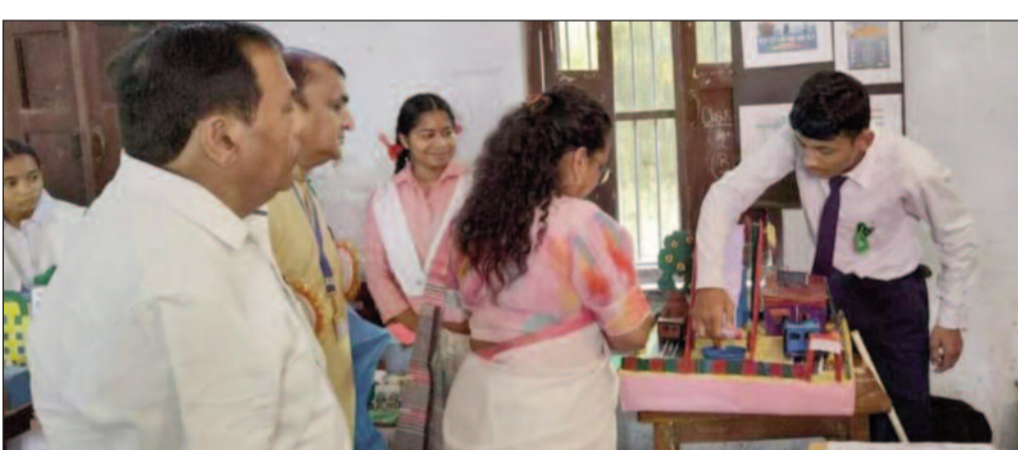
कोटद्वार में आयोजित विज्ञान महोत्सव के दौरान विद्यार्थियों द्वारा बनाए गए माडल देखते अतिथि।