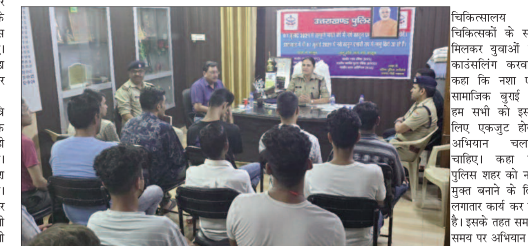
कोतवाली में युवाओं की काउंसलिंग करती पुलिस

चिकित्सालय के चिकित्सकों के साथ मिलकर युवाओं की काउंसलिंग करवाई। कहा कि नशा एक सामाजिक बुराई है। हम सभी को इसके लिए एकजुट होकर अभियान चलाना चाहिए। कहा कि पुलिस शहर को नशा मुक्त बनाने के लिए लगातार कार्य कर रही है। इसके तहत समन्वय पर अभियान भी चलाए जाते हैं। युवाओं को नशे से दूर करने का भी संकल्प दिलाया। कहा कि नशा धन के साथ ही परिवारों को भी बर्बाद कर देता है। कोतवाली में आयोजित कार्यशाला में पुलिस अधीक्षक जया बल्लोनी ने बेस