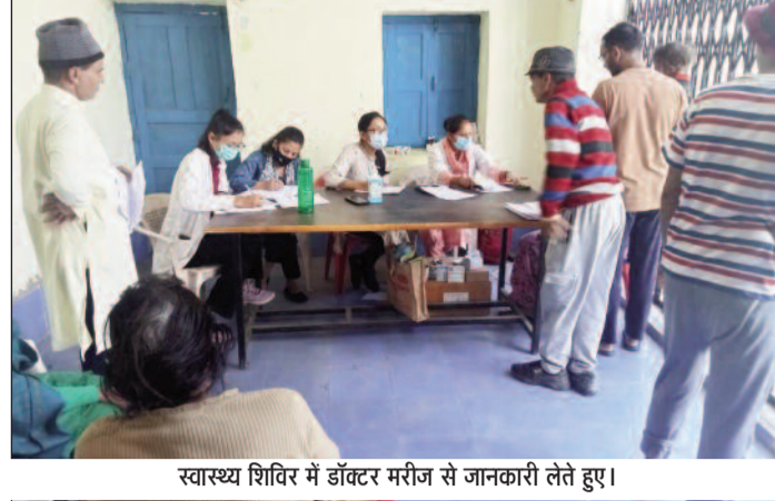
स्वास्थ्य शिविर में डॉक्टर मरीज से जानकारी लेते हुए।