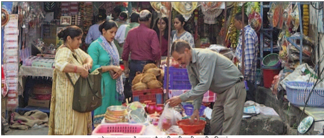
कोटद्वार बाजार में करवा चौथ की खरीददारी करती महिलाएं

जयन्त प्रतिनिधि। कोटद्वार : करवाचौथ को लेकर कोटद्वार का बाजार सजने लगा है। महिलाओं ने बाजार में पहुंचकर खरीदारी करना शुरू कर दिया है। करवा, कलश, शाली सहित अन्य सामान खरीदने के लिए महिलाओं की भीड़ उमड़ी हुई थी। हाथों में मेहंदी लगवाने के लिए भी महिलाओं में काफी उत्साह देखने को मिला।