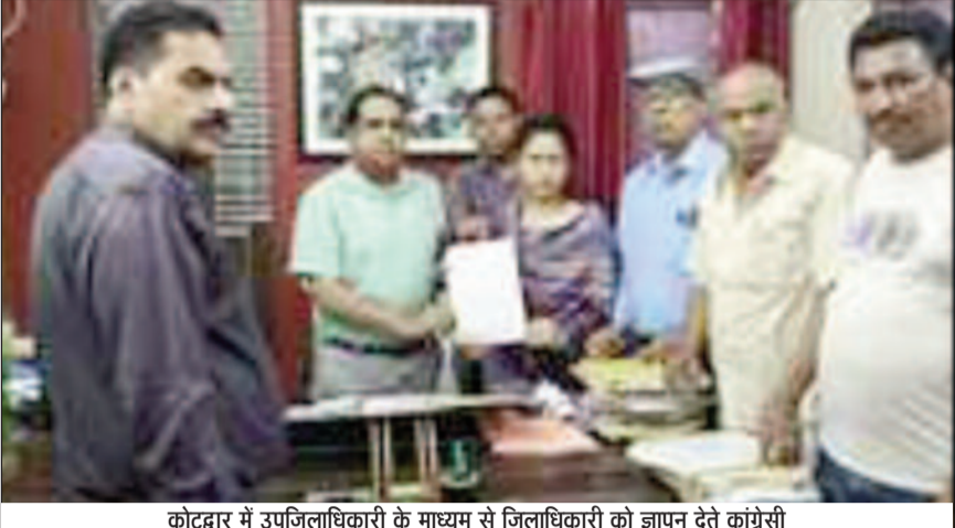
कोटद्वार में उपजिलाधिकारी के माध्यम से जिलाधिकारी को ज्ञापन देते कांग्रेसी

जयन्त प्रतिनिधि। राष्ट्रीय राजमार्ग के प्रभावितों को बाजार नंबर एक, दो व तीन में राष्ट्रीय राजमार्ग के बाइपास का निर्माण का कार्य प्रारंभ हो