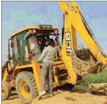
नोटिस चस्पा करते अधिकारी

बहराइच स्थित महसो तहसील क्षेत्र के महाराजगंज कस्बे में हुई हिंसा के मुख्य आरोपी अब्दुल हमीद के घर पर जल्द ही योगी सरकार का बुलडोजर चलने जा रहा है। शुक्रवार की शाम लोकनिर्माण विभाग द्वारा इनके घर पर अतिभ्रमण को लेकर नोटिस चस्पा की गई है। यदि तीन दिनों में इनके द्वारा इसका जवाब न दिया गया तो पूरे घर को ध्वस्तिकरण करने की कार्यवाही होगी। इसके साथ ही यहां के करीब 30 घरों पर यह नोटिस चस्पा हो रही है। ऐसे में इन सभी के खिलाफ बुलडोजर एक्शन होना तय माना जा रहा है। यह सभी इस हिंसा में शामिल आरोपियों के ही घर बताया जा रहे हैं। वहीं इस मामले में लापरवाही मिलने पर एएसपी को भी नोटिस की तैयारी है। जबकि तहसीलदार को डीएम कार्यालय अटैच कर दिया गया है।