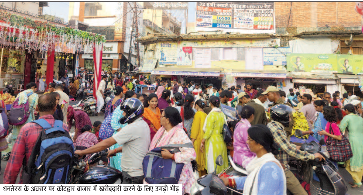
धनतेरस के अवसर पर कोटद्वार बाजार में खरीददारी करने के लिए उमड़ी भीड़

वहीं, लोहारी सीजन को देखते हुए प्रशासन द्वारा जगह-जगह पुलिस गश्त करती रही। नजीबवाद से झंडाचौक, झंडाचौक से बदरीनाथ मार्ग व रेलवे स्टेशन पर सड़क किनारे दुकानें सजनी शुरू हो गई हैं। ग्रामीण इलाकों से पहुंचे लोग भी जमकर सामानों की खरीद करते हुए नजर आए जिससे व्यापारियों के चेहरे खिल उठे। लोहार में फड़ लगाने के लिए सड़कों पर जगह घेरने के लिए दुकानदारों में होड़ लगी हुई थी। सुबह से