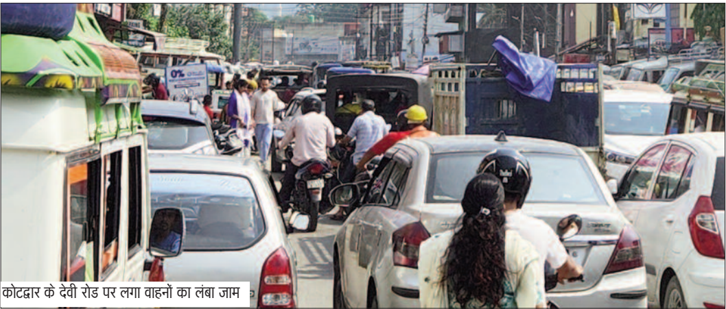
कोटद्वार के देवी रोड पर लगा वाहनों का लंबा जाम