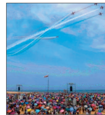
ट्रेन छूट गई।

चेन्नई। भारतीय वायुसेना (आईएएफ) का रेतौले मरीना बीच पर एयर शो का आयोजन काफी लोकप्रिय रहा, लेकिन रविवार को इस खूबसूरत तट पर जुटे हजारों लोगों के पास चिंतारिपट को जोड़ने वाला सबसे नजदीकी जंक्शन है, पर सैकड़ों लोग उमड़ पड़े और कई लोगों को प्लेटफॉर्म पर खड़े होने के लिए पैर रखने तक की जगह नहीं मिली। इसके बावजूद कई लोगों ने यात्रा करने का जोखिम उठाया, जबकि अन्य को