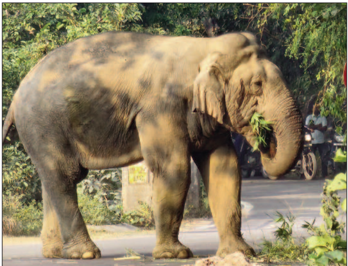
कोटद्वार-दुर्गछा के मध्य राष्ट्रीय राजमार्ग पर धमका हाथी

जयन्त प्रतिनिधि। कोटद्वार : यदि आप कोटद्वार-दुर्गछा के मध्य राष्ट्रीय राजमार्ग पर सफर कर रहे हैं तो जरा सावधान हो जाएं। दूरअसल, इन दिनों