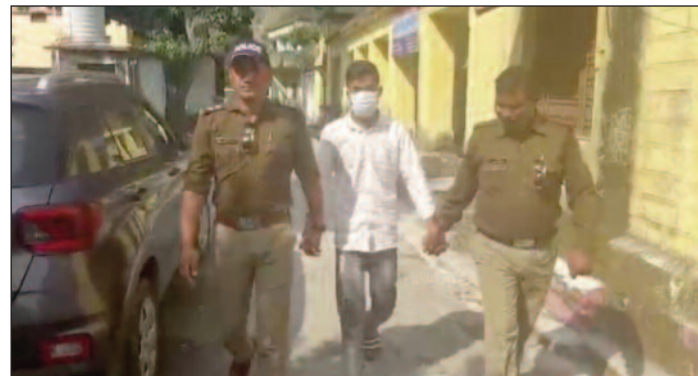
पुलिस हिरासत में आरोपी

जयन्त प्रतिनिधि। कोटद्वार : युवती का अश्लील वीडियो व फोटो सोशल मीडिया में वायरल करने वाले आरोपी को पुलिस ने गिरफ्तार कर लिया है। फोटो व वीडियो वायरल होने के बाद से युवती भी घर से लापता चल रही थी। जिसकी पुलिस ने सकुशल कोटद्वार से बरामदगी कर ली है। इस संबंध में पैदाणी निवासी युवती के जीजा की ओर से पुलिस को तहरीर दी गई थी। जिसमें उन्होंने बताया था कि पांच नवंबर को उनकी साली बाजार गई हुई थी। लेकिन, देर रात तक भी वह घर लौटकर नहीं आई। दोस्तों व रिश्तेदारों से पूछने पर भी उसका कुछ पता नहीं चल पाया है। तहरीर पर पुलिस ने गुमशुदगी दर्ज कर युवती की तलाश शुरू कर दी थी। बुधवार सुबह पुलिस ने युवती को सकुशल कोटद्वार से बरामद किया।