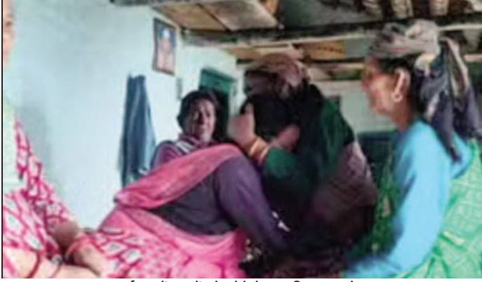
बस दुर्घटना में अपनों को खोने के बाद विलाप करते स्वजन