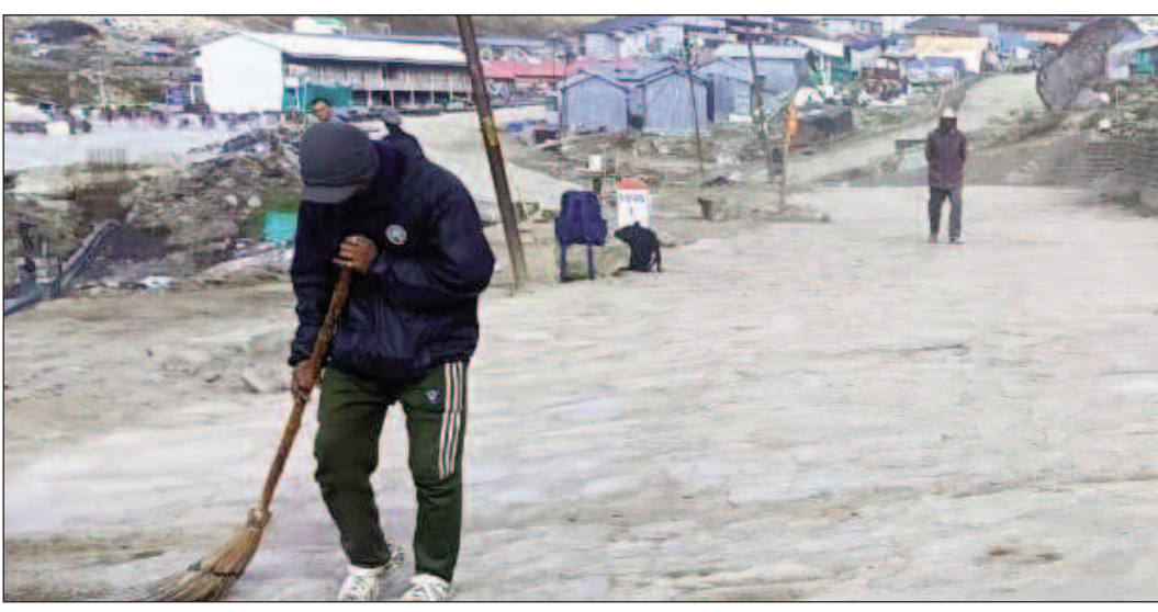
श्री केदारनाथ धाम यात्रा 2024 को लेकर जिलाधिकारी सोरभ गहवरार द्वारा किए गए कार्यों की लगातार प्रशांसा हो रही है। यात्रा मार्ग एवं यात्रा की सुगम एवं सफल बनाने के लिए इस वर्ष जिला प्रशासन द्वारा किए गए नए प्रयोग एवं

जयन्त प्रतिनिधि। रुद्रप्रयाग : श्री केदारनाथ धाम यात्रा का सफल एवं व्यवस्थित संचालन करने के बाद अब जिला प्रशासन धाम एवं यात्रा मार्ग की स्वच्छता व्यवस्था में जुट गया है। जिलाधिकारी सोरभ गहवरार के निर्देशन एवं निगरानी में केदारपुरी सहित पैदल यात्रा मार्ग पर विशेष स्वच्छता अभियान चलाया जा रहा है। स्वच्छता अभियान के तहत प्लास्टिक कचड़ा, जैविक कूड़ा एवं वेस्ट मैटीरियल का निस्तारण जाएगा। जिला प्रशासन की मंशा है कि पर्यावरण को होने वाले अनावश्यक नुकसान को कम किया जा सके साथ ही बर्बादी से पहले सभी वेस्ट मैटीरियल निस्तारित हो जाए जिससे अनावश्यक गर्दगी कहीं भी न फैले एवं अगले वर्ष यात्रा मार्ग पर स्वच्छता व्यवस्था पहले से दुरुस्त रहे।