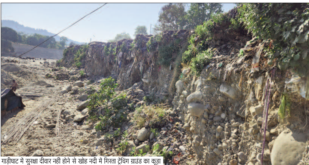
गाड़ीघाट में सुरक्षा दीवार नहीं होने से खोह नदी में गिरता ट्रेचिंग ग्राउंड का कूड़ा

जयन्त प्रतिनिधि। कोटद्वार : नगर निगम अपनी जिम्मेदारियों को लेकर कितना लापरवाह है इसका अंदाजा इस बात से लगाया जा सकता है। बजट जारी होने के बाद भी नगर निगम गाड़ीघाट में बाढ़ सुरक्षा दीवार निर्माण को सुध नहीं ले रहा। नतीजा ट्रेचिंग ग्राउंड की गंदगी खोह नदी में गिरने से उसका जल दूषित हो रहा है। जबकि, कई कायदाकारी नदी के जल का उपयोग खेती व मवेशियों को पिलाने के लिए करते हैं। गत वर्ष 13 अगस्त को हुई अतिवृष्टि से उफान पर बनी खोह नदी ने ट्रेचिंग ग्राउंड की सुरक्षा दीवार को बहा दिया था। यही नहीं ट्रेचिंग ग्राउंड का कुछ हिस्सा भी नदी की भेंट चढ़ गया था। वर्षा काल के बाद से ट्रेचिंग ग्राउंड का कूड़ा