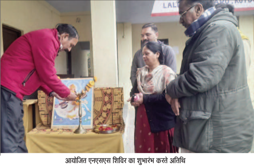
आयोजित एनएसएस शिविर का शुभारंभ करते अतिथि