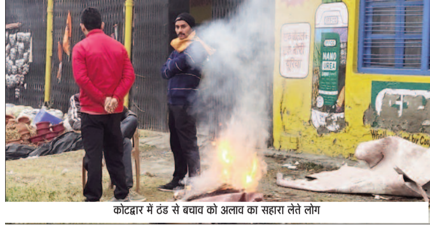
कोटद्वार में ठंड से बचाव को अलाव का सहारा लेते लोग