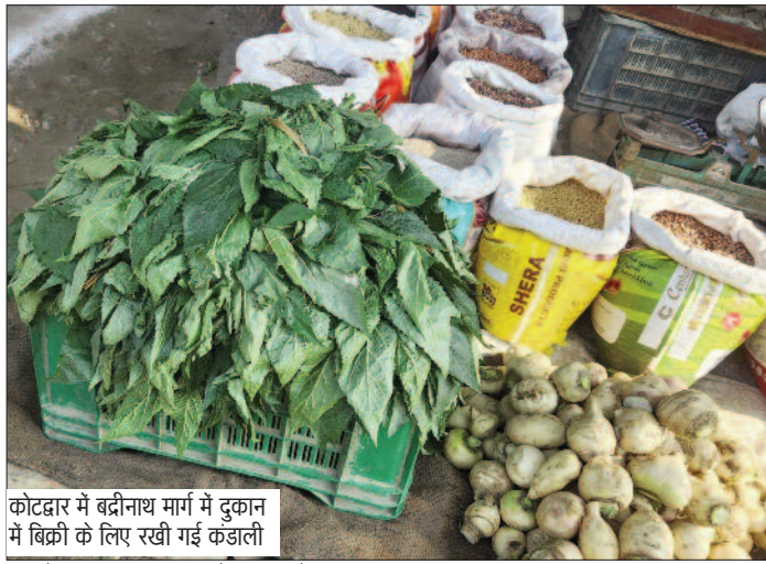
कोटद्वार में बद्रीनाथ मार्ग में दुकान में बिच्छी के लिए रखी कंडाली

कोटद्वार बाजार में 60 से 80 रुपये किलो बिक रही कंडाली