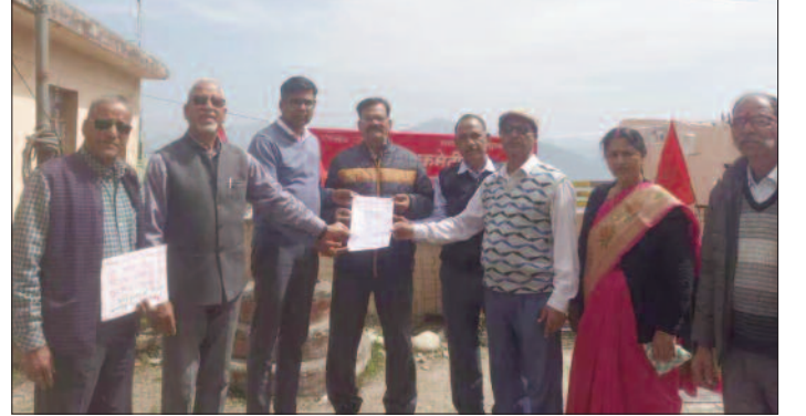
मोबाइल बांटे थे और अब उसी कंपनी से महंगे टैरिफ वसूलने का काम किया जा रहा है। माकपा ने आरोप लगाया कि स्मार्ट मीटर के नाम पर सरकार जनता को छलने का काम कर रही है। उदाहरण देते हुए कहा कि पहले एक कंपनी ने मुन्नत में सिम और

नई टिहरी : बिजली के निजीकरण और स्मार्ट मीटर के खिलाफ मार्क्सवादी कम्युनिस्ट पार्टी (माकपा) ने राज्यव्यापी आह्वान पर नई टिहरी में ऊर्जा निगम के कार्यालय पर धरना प्रदर्शन किया। इसके बाद ऊर्जा निगम के ईई को ज्ञापन भी सौंपा। धरने के बाद सौंपे गए ज्ञापन में माकपा ने कहा कि वह बिजली के निजीकरण और स्मार्ट मीटर का पुरजोर विरोध करती है। पार्टी ने इसे एक जनविरोधी फैसला बताते हुए आरोप लगाया कि यह सरकार का चोर दरवाजे से बिजली के निजीकरण की ओर बढ़ाया गया कदम है, जिसका सीधा नुकसान गरीब जनता, किसानों और मजदूरों को होगा। माकपा ने आरोप लगाया कि स्मार्ट मीटर के नाम पर सरकार जनता को छलने का काम कर रही है। उदाहरण देते हुए कहा कि पहले एक कंपनी ने मुन्नत में सिम और