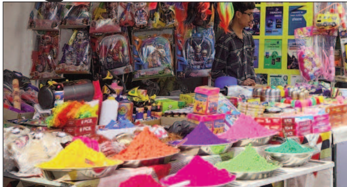
होली का रंग निहट आने के साथ ही कोटद्वार क्षेत्र में सजी होली के सामान की दुकानें

कुछ दिन बाद होली का त्योहार मनाया जाना है। ऐसे में कोटद्वार बाजार में होली का रंग नजर आने लगा है।