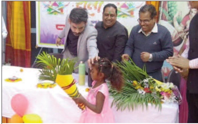
कोटद्वार में बोक्सा जनजाति के बच्चों संग होली मनाते जिलाधिकारी

जयन्त प्रतिनिधि। कोटद्वार : मंगलवार को कोटद्वार पहुंचे जिलाधिकारी डा. आशीष चौहान ने हल्दुखाता में बोक्सा जनजाति बालिका विद्यालय में जनजाति के बच्चों संग होली का त्योहार मनाया। इस दौरान जिलाधिकारी ने बोक्सा जनजाति के लोगों को सरकारी योजनाओं का अधिक से अधिक लाभ उठाने की मांग की है। हल्दुखाता स्थित जनजाति बालिका विद्यालय में कार्यक्रम का आयोजन किया गया। कार्यक्रम में जिलाधिकारी ने बच्चों संग होली का पर्व मनाते हुए उन्हें उपहार भी भेंट किए। साथ ही उन्होंने बच्चों के साथ भोजन भी किया। जिलाधिकारी ने कहा कि हमारी प्राथमिकता है कि कोई भी बच्चा शिक्षा के अधिकार से वंचित न रहे। कहा कि प्रत्येक बच्चा प्राथमिक शिक्षा से लेकर उच्च स्तरीय शिक्षा का हकदार है। हर बच्चा पढ़-लिख कर अपनी इच्छा के मुताबिक जीवन स्तर को बेहतर बना