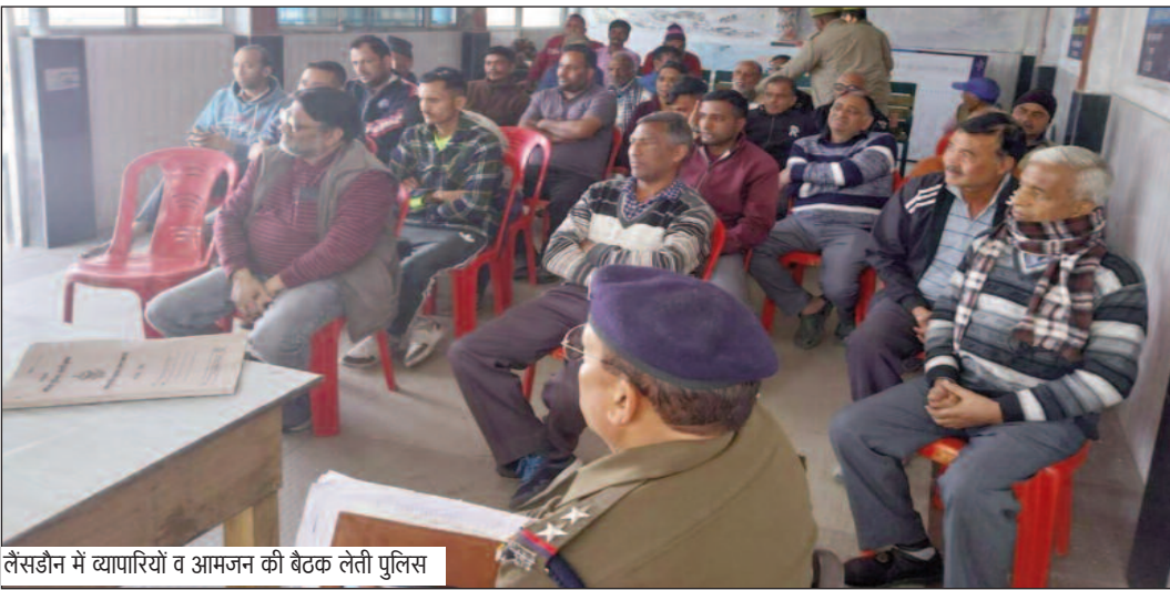
लैसडीन में व्यापारियों व आमजन की बैठक लेती पुलिस

अबीर-गुलाल के साथ ही पिस्टल, राकेट, गिटार के साथ ही संगीत की तान छोड़ने वाली पिचकारी बच्चों को खूब लुभा रही है। होली के रंग से बाल की सुरक्षा के लिए बाजार में बनावटी बाल भी उपलब्ध हैं। बाजार में बनावटी बाल की कीमत सौ रुपये से शुरू है। बाजार में कैमिकल रंगों के बजाय हर्बल रंग अधिक विक्र रहे हैं।