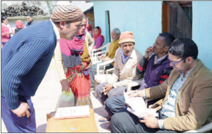
बैठक के दौरान ग्रामीणों ने मोबाइल नेटवर्क की समस्या से अवगत कराते हुए कहा कि क्षेत्र में कनेक्टिविटी की समस्या बनी रहती है। इसके साथ ही ग्रामीणों द्वारा अवगत कराया कि पांच गांवों ग्राम सभाओं में एक ही आशा कार्यकर्ता कार्यरत है। ग्रामीणों का कहना था कि

मंगलवार को ज्ञापन भेजते हुए विभिन्न संगठनों के पदाधिकारियों ने कहा कि स्मार्ट मीटर से गरीब, किसानों, मजदूरों व मध्य मवर्गीय परिवारों को समस्याओं का सामना करना पड़ेगा। कहा कि बिजली के निजीकरण के लिए पांच बार लोकसभा में बिजली बिल बहुमत