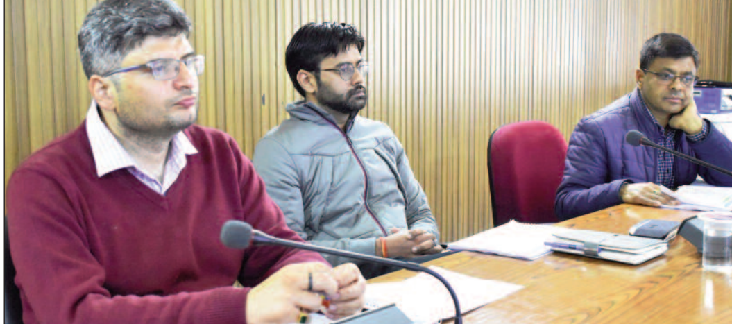
तायों को अंडर ग्राउंड करने को लेकर प्रस्ताव बनाने, शिक्षा विभाग को गैरसैनिक लैबरेटरी का प्रस्ताव बनाने तथा नगर पंचायत व पेवलज विभाग को रेन वॉटर हार्वेस्टिंग का प्रस्ताव बनाने को कहा।

जिलाधिकारी ने सभी विभागों को आगामी 25 वर्षों के हिसाब से कार्य योजना बनाने, पीडब्ल्यूडी को निरीक्षण भवन के विस्तारिकरण और डेयरी को सिमली मिल्क प्लांट का अपग्रेडेशन का प्रस्ताव बनाने के निर्देश दिए। डीएम ने वृषीसीएल को विद्युत