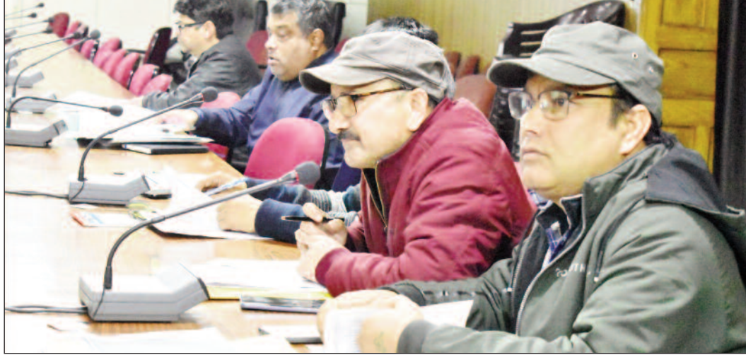
को कहा। साथ ही जिलाधिकारी ने सभी विभागों को बड़े प्रोजेक्टों की प्रगतिके फोटोग्राफ्स उपलब्ध कराने के निर्देश दिए।

उन्होंने सिंचाई विभाग को जोशीमठ व दशोली ब्लॉक के बाढ़ प्रोटेक्शन कार्यों के प्रस्ताव बनाने व मत्स्य विभाग को आरआईडीएफ के तहत मंडल व देवाल में ट्राउट मछली के बड़े प्रोजेक्ट बनाने