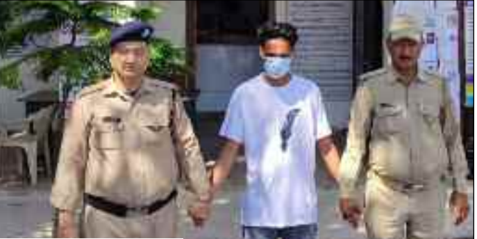
कोटद्वार पुलिस की हिरासत में आरोपी