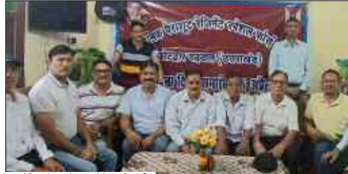
आयोजित बैठक में भाग लेते पदाधिकारी

मदपुर में आयोजित बैठक में व्यवस्थाओं को लेकर चर्चा की गई। वक्ताओं ने कहा कि इस बार स्पेशल फोर्स का स्थापना दिवस बड़े धूमधाम से मनाया जाएगा, जिसमें गौरव सैनिक के स्वजनों की तरफ से सांस्कृतिक कार्यक्रमों की भी प्रस्तुति दी जाएगी, साथ ही गौरव सैनिकों की समस्याओं को लेकर भी चर्चा की जाएगी। कहा कि कार्यक्रम चमडपुर स्थित एक रेस्टोरेंट में