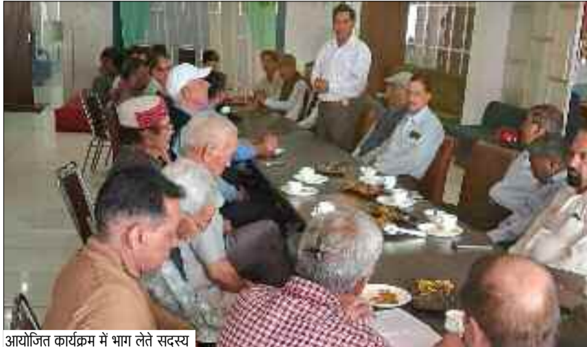
आयोजित कार्यक्रम में भाग लेते सदस्य

बैठक में तय किया गया कि, सभी शिक्षण संस्थानों में जन-जागरूक के लिए संवाद से समाधान कार्यक्रम का आयोजन किया जाएगा। इस कार्यक्रम के प्रथम चरण में कण्वनगरी कोटद्वार के सभी उच्च शिक्षण संस्थानों में एक भाषण प्रतियोगिता का आयोजन करवाया जायेगा। प्रत्येक संस्थान से दो सर्वश्रेष्ठ प्रतिभागियों का चयन कर एक अन्तर उच्च शिक्षण संस्थान भाषण प्रतियोगिता